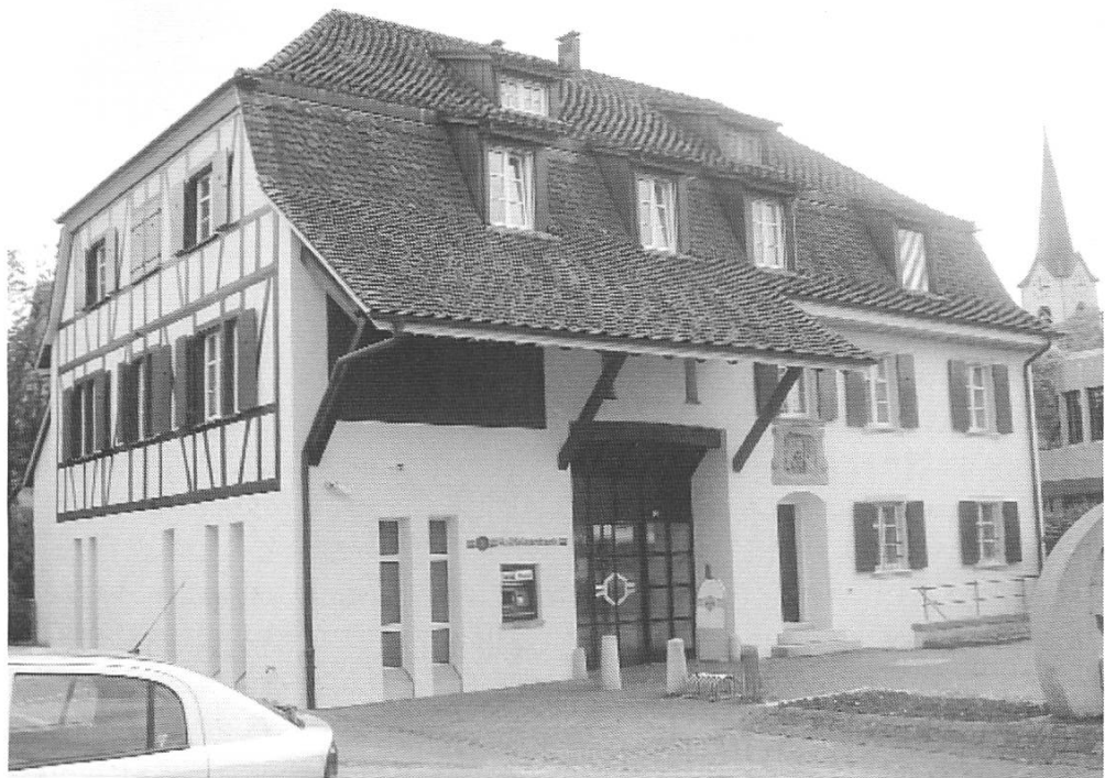
Ansicht der Raiffeisenkasse (Küry-Haus) an der Hauptstrasse

weniger an deren ökonomischen Effizienz. Vielmehr stand ihre Idee im Einklang mit dem tiefen Misstrauen gegenüber den zentralstaatlichen Instanzen, das die basellandschaftliche Politik noch bis ins 20. Jahrhundert hinein prägte.