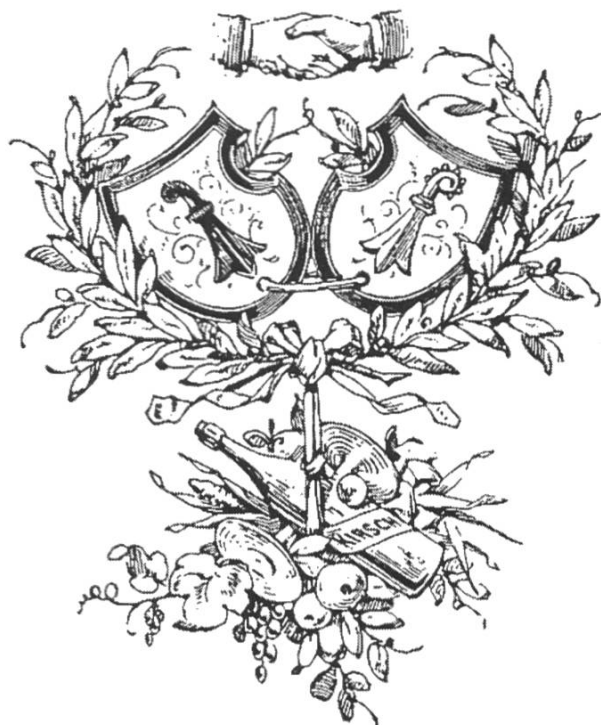
Vereinslogo, aus: P. Suter: Chränzli, S. 444.

Das Vereinslogo bestätigt diese Annahmen: Es zeigt die Wappen der zwei Basler Halbkantone, die durch einen Ring zusammengehalten und von einem Kranz umringt werden. Daraus schliesse ich, dass das «Baselbieter Chränzli» die beiden Halbkantone miteinander verbinden und keinesfalls einander gegenüber stellen wollte. Dazu passt eigentlich auch die Tatsache, dass eine von den Stimmberechtigten beider Basler Halbkantone angenommene Wiedervereinigungsinitiative zur Auflösung des Vereins führte. Wäre es tatsächlich zur Wiedervereinigung gekommen, hätte sich die Berechtigung des Baselbieter Heimatvereins quasi erübrigt, denn dann hätte ja jeder Bürger aus Basel-Landschaft und Basel-Stadt – zumindest «theoretisch» – die gleiche «Heimat» gehabt.