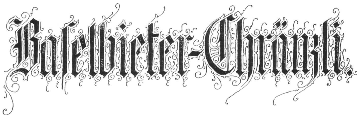
Titelblatt des Protokollbuches, aus: StABL NA 2183 B 4. a

kurze Lebensläufe verstorbener Mitglieder, wodurch eine genauere Identifizierung jener möglich wird. 9