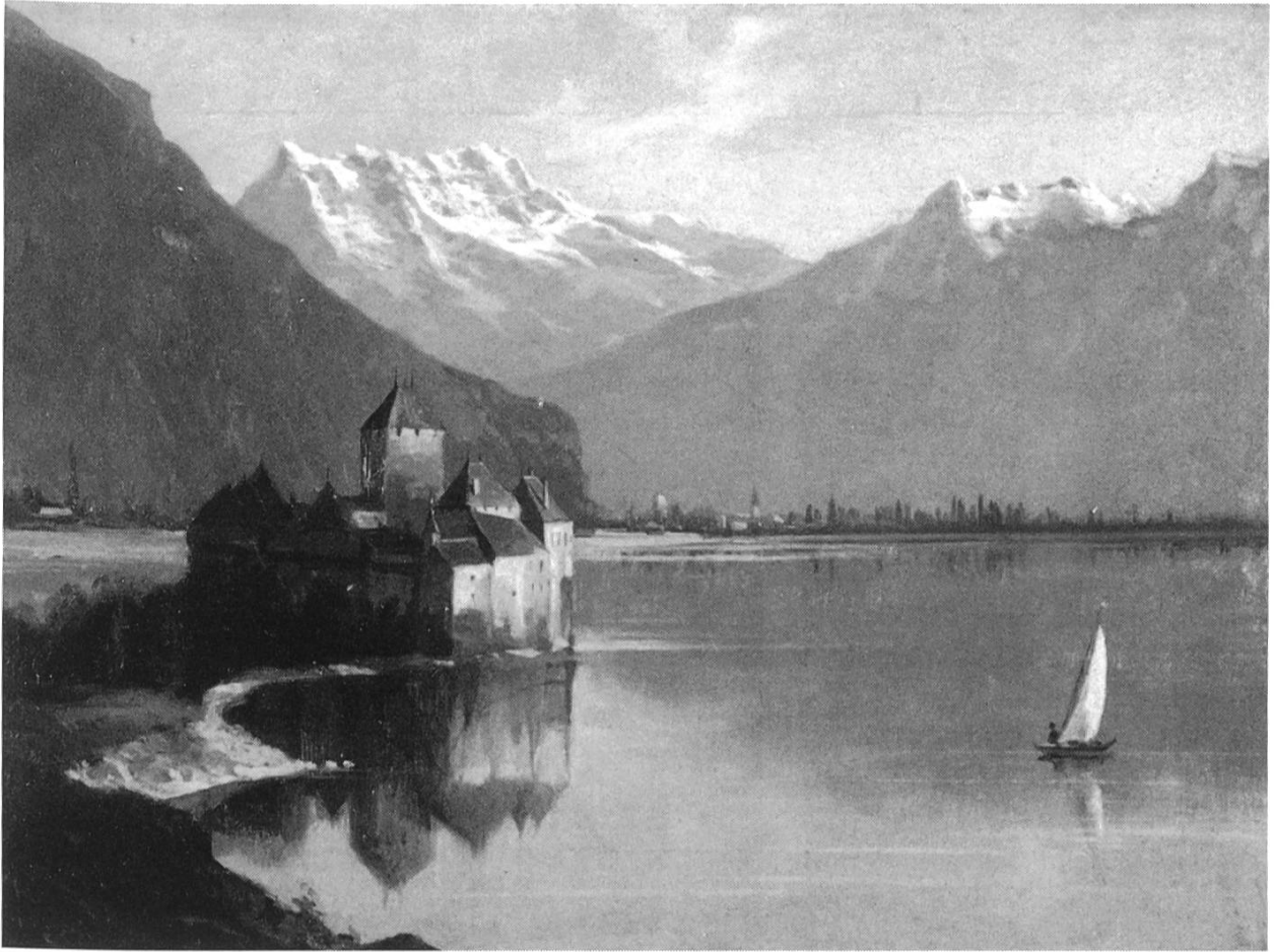
Wilhelm Balmer, Vater: Genfer See mit Schloss Chillon. Öl auf Malkarton; 32,5 x 45,5 cm; undatiert. (Kantonsmuseum Baselland Liestal)

Kanton Basel-Landschaft, der – vor allem mit seinen «Bildern aus der Schweizergeschichte» – in der ganzen Schweiz bekannt wurde. Zur Basler Künstlerschaft hatte er kaum Beziehungen. Dort begegnete man einem Baselbieter Künstler, der aus ärmlichen Verhältnissen stammte und nicht das städtische Gymnasium besucht hatte, mit grosser Skepsis. Doch fand Jauslin im Basler Bürgertum viel Zuspruch, da man dort dessen patriotische Gesinnung schätzte, die seinen Historienbildern zugrunde lag.