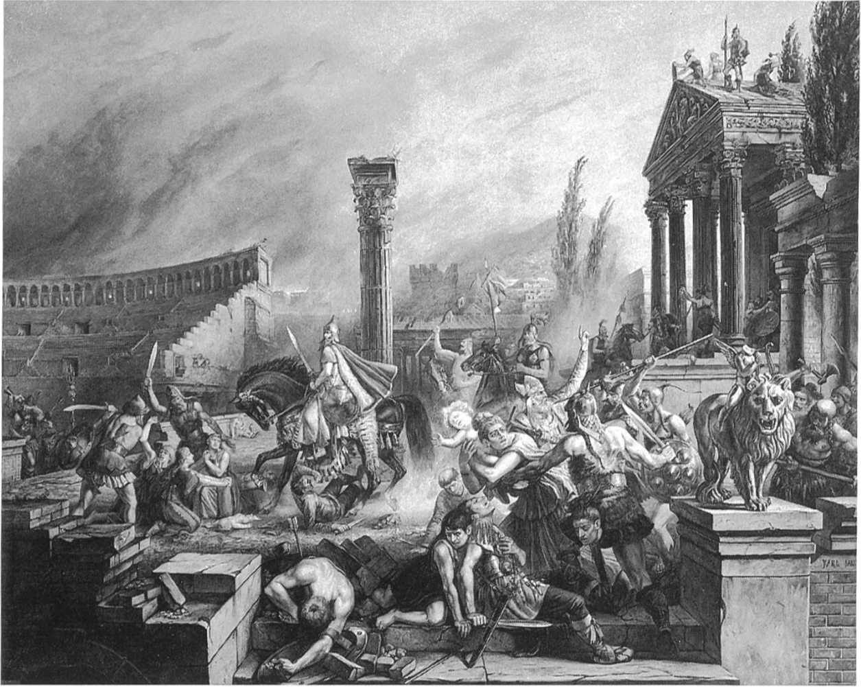
Karl Jauslin: Die Hunnen zerstören Augusta Raurica. Aquarell; 64,5 x 84,3 cm; 1898