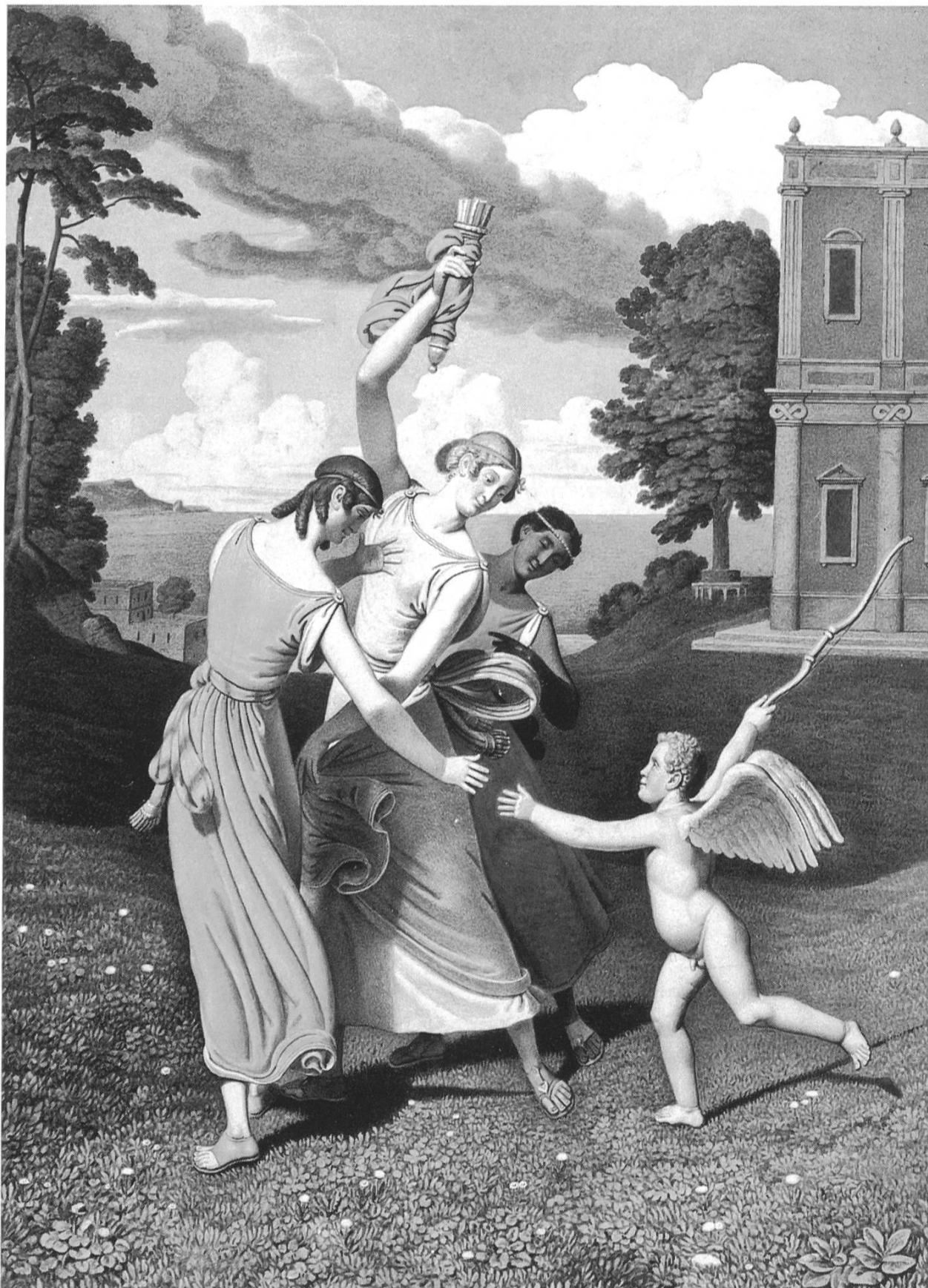
Johannes Senn: Amor und die drei Grazien. Aquarell; 50,5 x 43 cm; undatiert. (Kantonsmuseum Baselland Liestal)