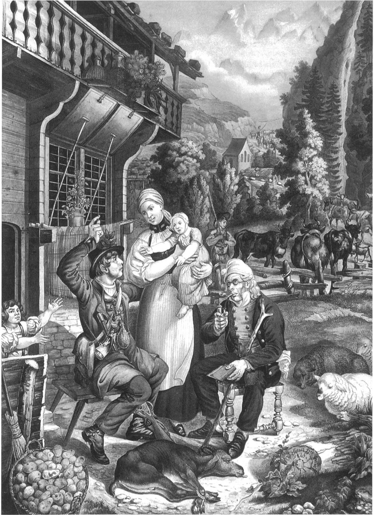
Jakob Senn: Heimkehr des Gemsjägers. Feder, Aquarell; 41,7 x 33,9 cm; 1849. (Kantonsmuseum Baselland Liestal)