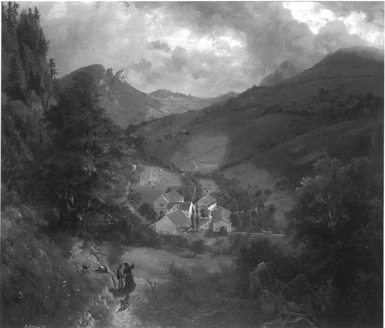
Arnold Jenny: Blick auf Kloster Schöntal. Öl auf Leinwand; undatiert. (Kantonsmuseum Baselland Liestal)