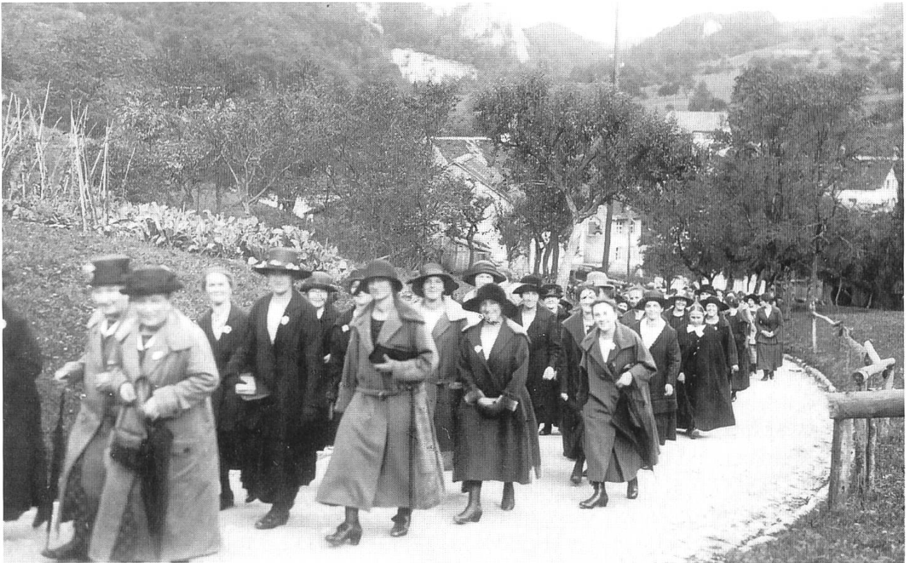
7: Eine Gruppe «blauer» Oberbaselbieterfrauen auf einem Ausflug im Jura. Die Aufnahme dürfte Ende der zwanziger Jahre entstanden sein.

«Teefest» durchgeführt wurde. Bald wurden diese Blaukreuzabende am Fasnachtmontag zu einer festen Institution. Eine stets bis zum letzten Platz vollbesetzte Halle freute sich jeweils an Musik und Liedern, labte sich an Brötli mit Wienerli und Tee und beklatschte das obligate