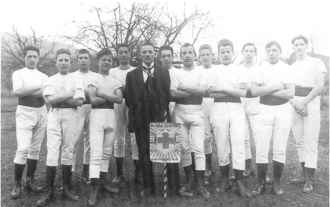
5: Eine Turnsektion bestehend vor allem aus Jünglingsbündlern aus Ormalingen. Auf dem Vereinsfähnchen die Inschrift: «Das blaue Kreuz im weissen Feld soll dringen durch die ganze Welt»