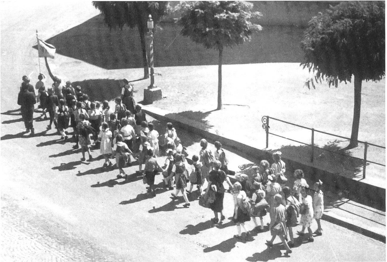
2: Eine Hoffnungsbund-Gruppe in Gelterkinden, auf der Bohnygasse, vor dem Platz des Schulhauses von 1876