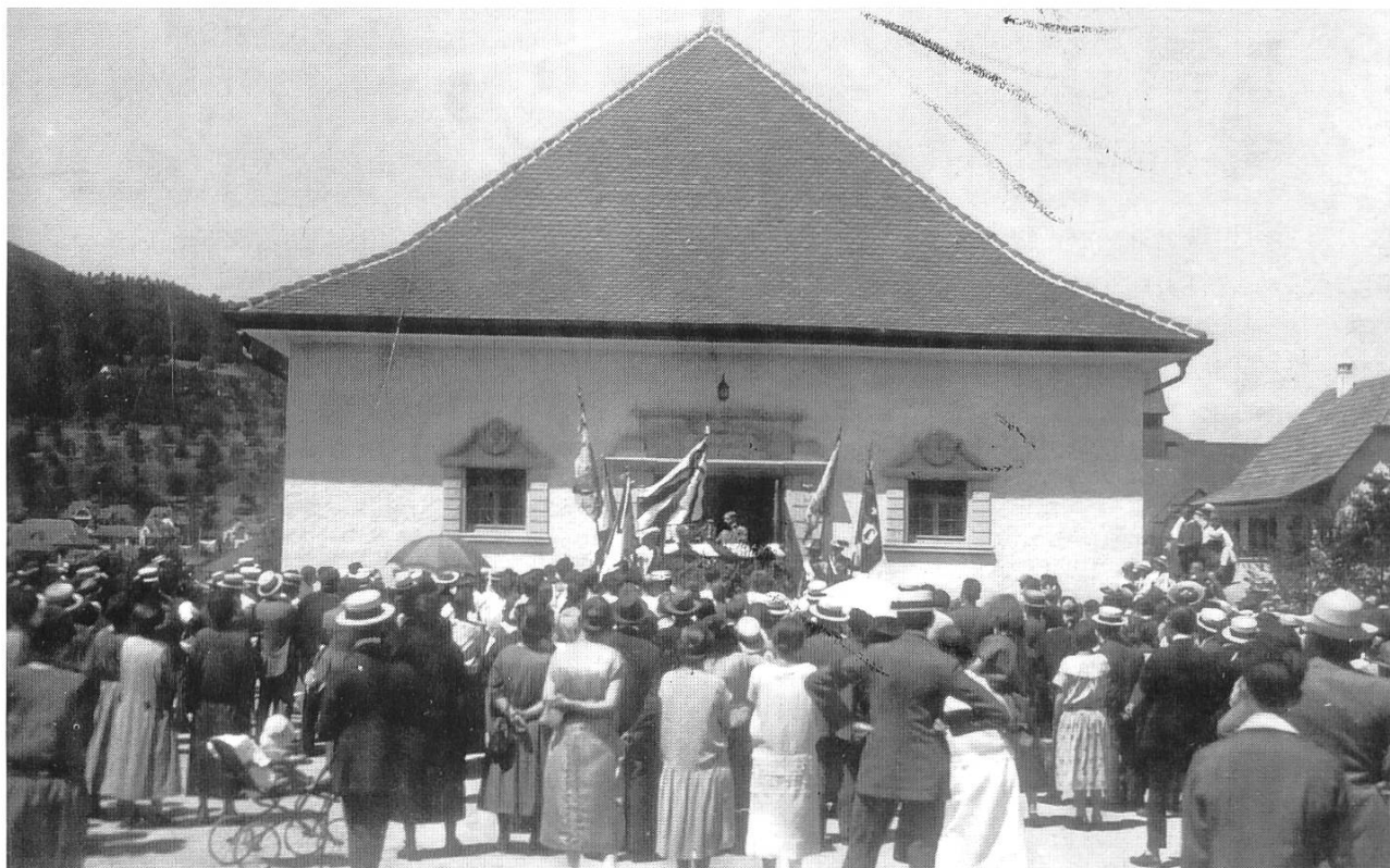
3: Teilnehmer an einem Erntedankfest des Blauen Kreuzes in Gelterkinder auf dem Vorplatz der 1920 erstellten und 1970 abgebrochenen Turnhalle am Balkenweg (heute: Mehrzweckhalle).

Volksbewegung. Gelegentlich kam aber die Einsicht, mit «Mässigkeit» allein könnten Trinker nicht «vom ewigen Verderben gerettet werden». «Temperenz» wurde deshalb durch «Abstinenz» ersetzt und aus dem «Mässigkeitsverein» ist (1882) das Blaue Kreuz entstanden.