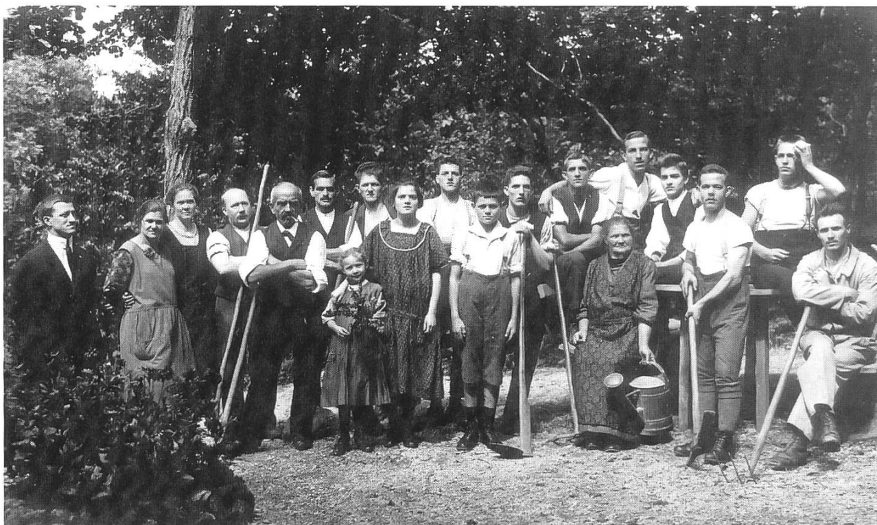
6: Mitglieder des Ormalingen Blaukreuzvereins stellen sich dem Fotografen. (Vermutlich anlässlich eines Arbeitseinsatzes zur Erstellung des Ruhe- und Aussichtsplatzes «Herrentischli», auf der Südwest-Seite des Wischberges).