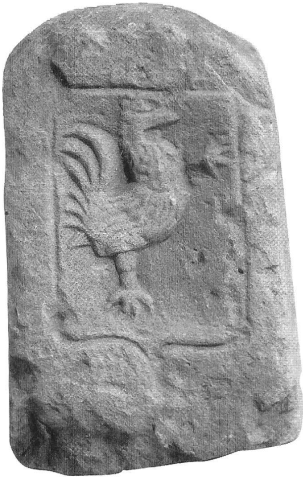
Güterstein mit Blarer-Wappen (Museum Aesch;)