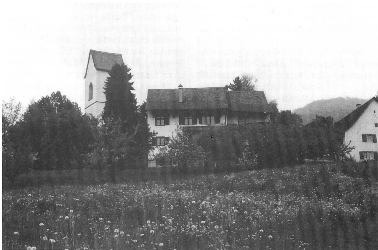
Der Kirchenweiler von Läufelfingen

Nach der Eröffnung der Eisenbahn sei Läufelfingen zu einem Eisenbahnerdorf geworden: Viele haben als Bremser gearbeitet, andere fanden Arbeit in den Oltner Werkstätten. Später siedelten sich verschiedene grössere Betriebe