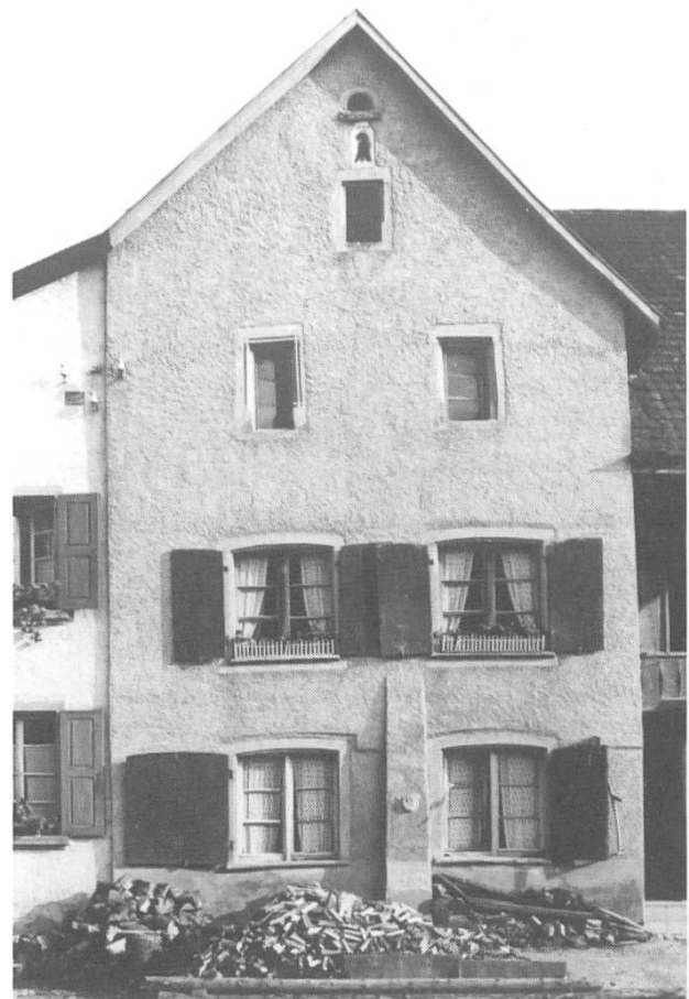
Abb. 4. Liegenschaft Bennwilerstrasse 1a/3 im Jahre 1942. Das dreigeschossige Haus trägt beim Giebelfenster die Jahrzahl 1539, die älteste in Diegten! Das Gebäude weist eine frühe Form des Steinbaus auf. Sehr wahrscheinlich ist es das älteste Steinhaus in Diegten. Der Stützpfeiler mit der Fratze wurde vor einiger Zeit abgerissen. Das Haus gehörte zu einem der beiden «Hueben»-Güter der Tenniker Kirche.