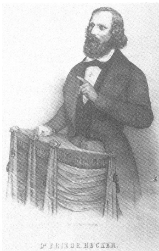
Abb. 7. Friedrich Hecker am Rednerpult. Nach einer zeitgenössischen Lithographie.

Von MuttENZ wanderte Hecker im September 1848 mit seiner Familie nach Amerika aus, wurde in Illinois Farmer und Winzer, war gemeinnützig tätig, nahm Partei für Präsident Abraham Lincoln, machte als Freiwilliger den Sezessionskrieg 1861–1865 auf Seiten