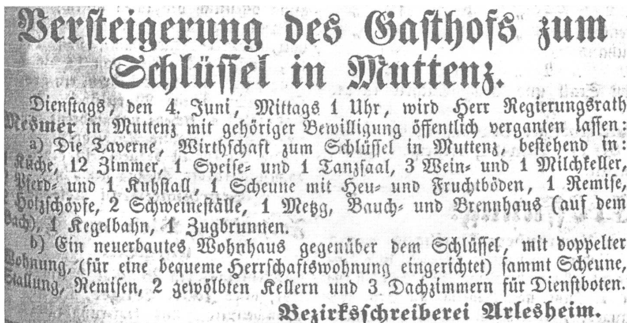
Abb. 2. Inserat aus der «Basellandschaftlichen Zeitung» vom 23. Mai 1861.