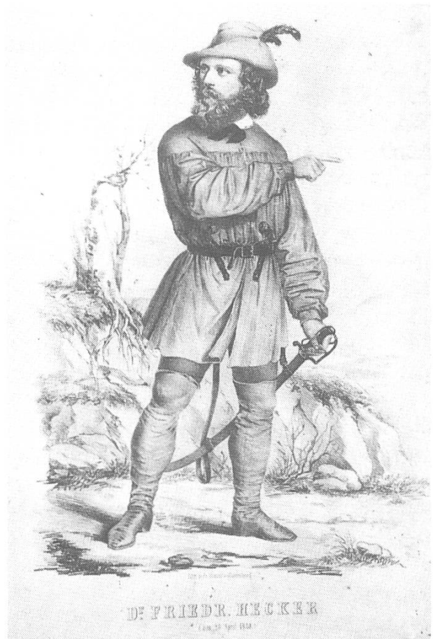
Abb. 6. Dr. Friedrich Hecker

Hecker studierte Jurisprudenz, wurde Dr. iur. und Rechtsanwalt beim badischen Obergerichtshof in Mannheim und bald ein führender Parlamentarier in der II. Badischen Kammer in Karlsruhe (etwa dem englischen Unterhaus vergleichbar), ferner Mitglied des