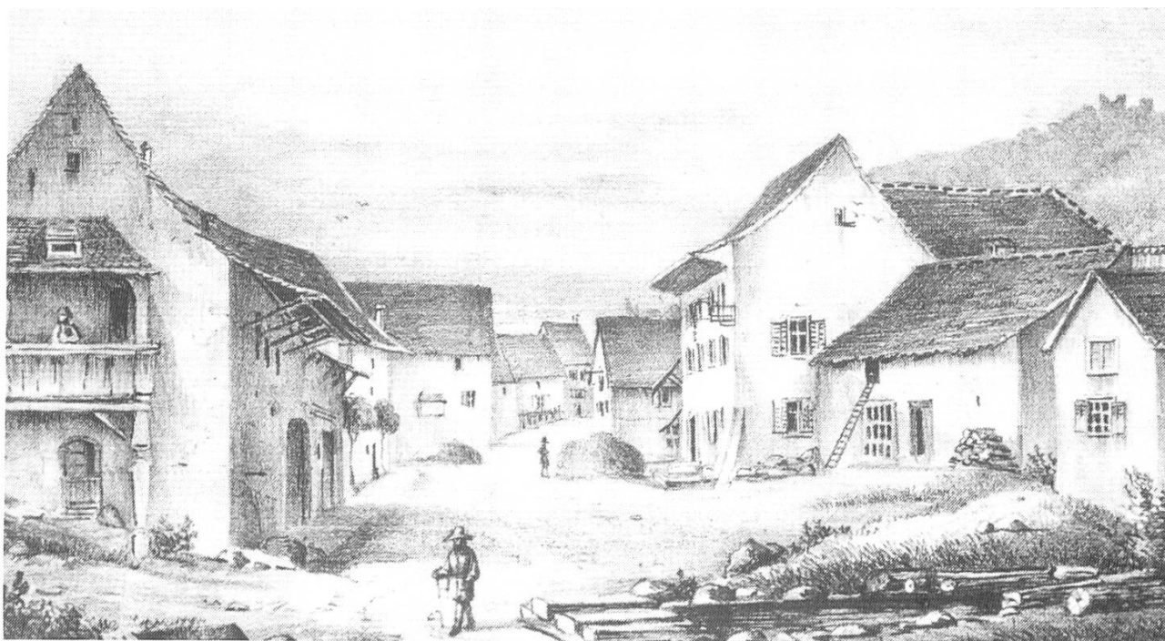
Abb. 1. Burggasse gegen Osten. Rechts Gasthaus «Schlüssel», im Vordergrund der offene Dorfbach.