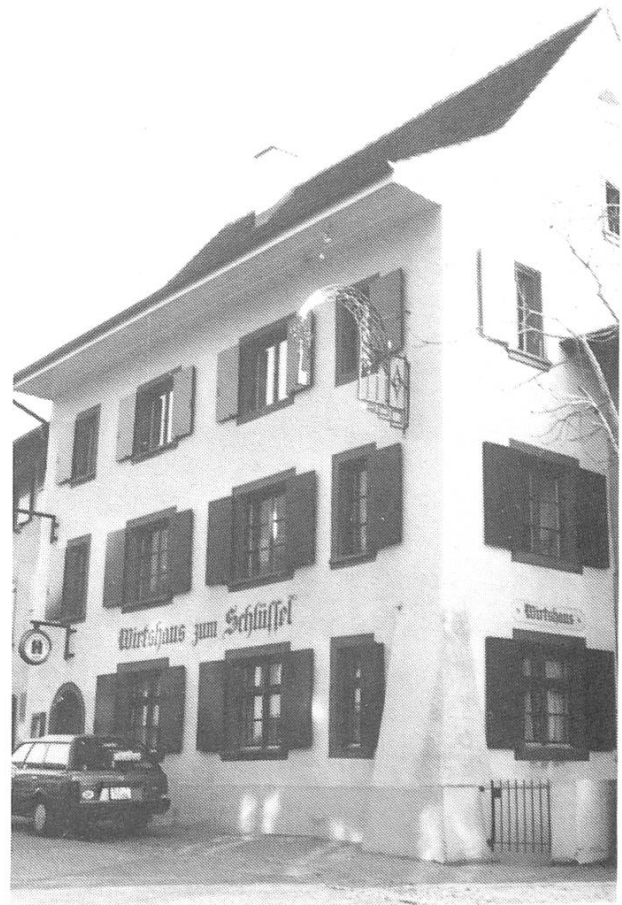
Abb. 5. Das Wirtshaus zum Schlüssel nach der Renovation von 1985.

1862, im Alter von 71 Jahren, also ein Jahr bevor er zum dritten Mal Regierungsrat wurde, verkaufte Mesmer den «Schlüssel» an Martin Dill von Pratteln. Mesmer starb am 11. November 1870 in MuttENZ. Er hatte nicht nur po-