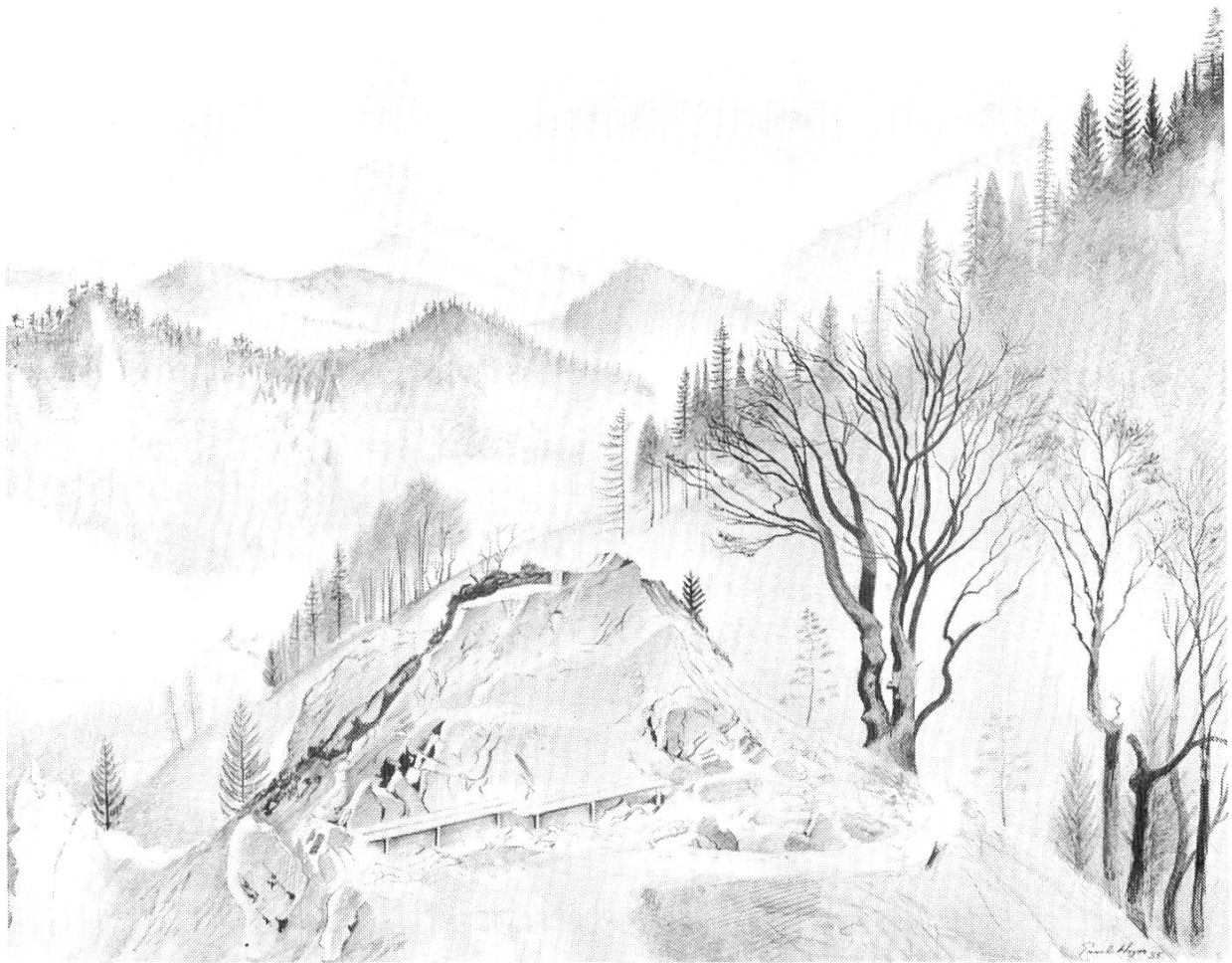
Abb. 2. Paul Wyss: Auf dem Belchengipfel, Farbstiftzeichnung, 54x66 cm, 1935

In diese Rubrik gehören folgende Neuerwerbungen: