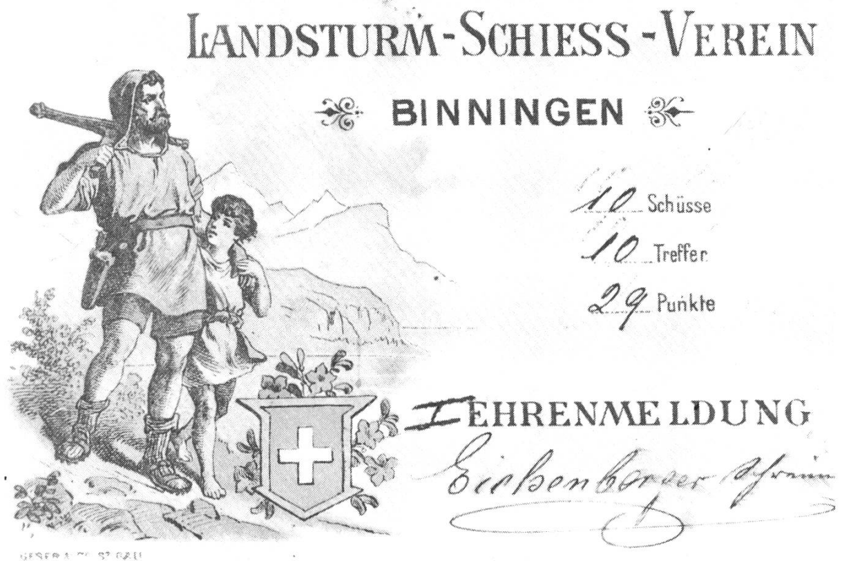
Abb. 6. Ehrenmeldung 1901, Farblithographie

Ein beträchtlicher Teil der in die Sammlung gelangten Objekte wurde geschenkt. Dies sei hier ausdrücklich und mit grosser Dankbarkeit erwähnt. Bei den überhöhten Preisen auf dem Kunstmarkt, ist ein Ankauf für eine staatliche Institution oft schwer und auch nicht verantwortbar. Umso erfreulicher ist es, wenn uns Objekte zu vernünftigen Preisen angeboten oder gar geschenkt werden. Die Aufgabe der Sammlung ist es ja nicht, materielle Werte anzuhäufen, sondern die Kulturgeschichte des Kantons zu dokumentieren.