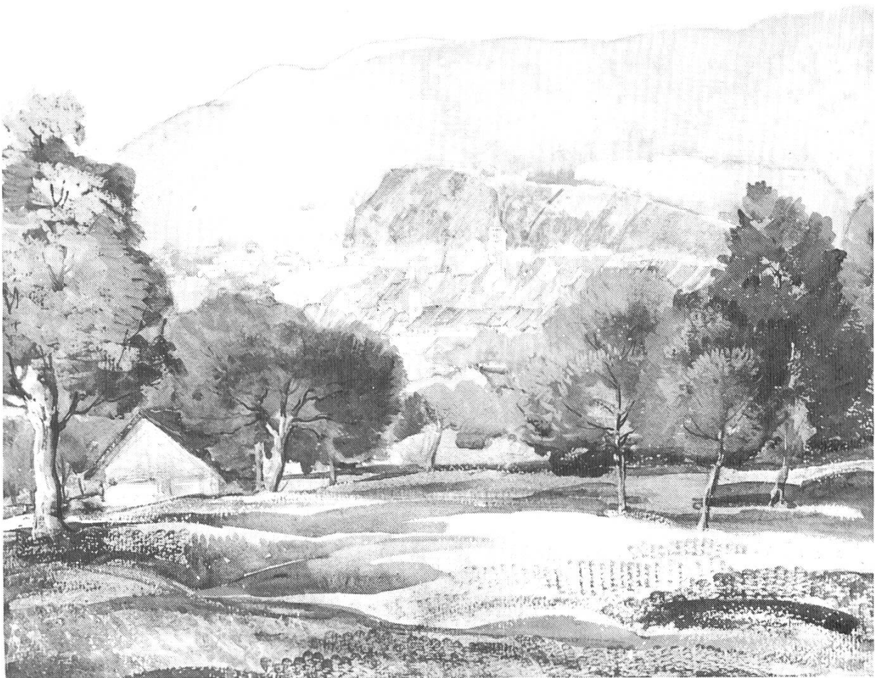
Abb. 4. Wilhelm Balmer: Blick auf Liestal, Aquarell, 44x55 cm, undatiert

Von Baselbieter Künstlern jener Zeit gelangten u. a. folgende Arbeiten in die Sammlung: