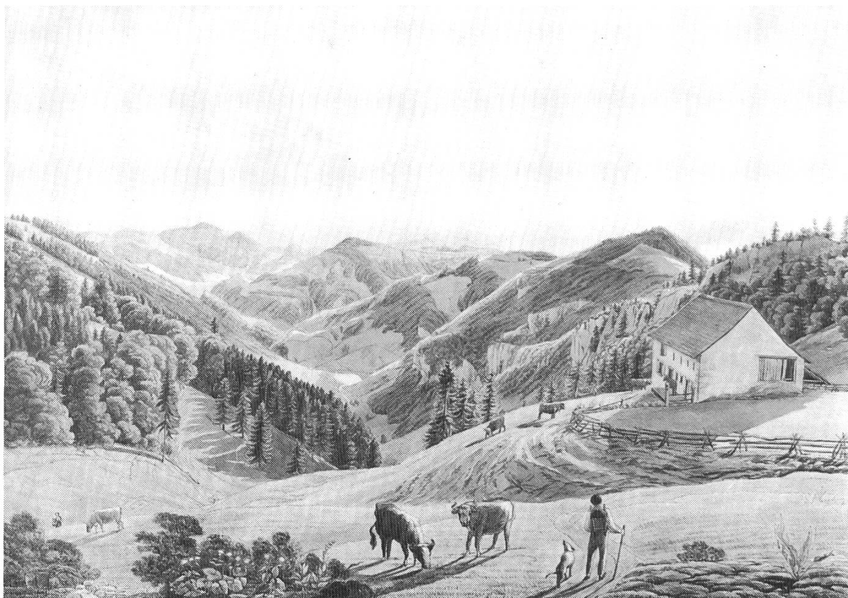
Abb. 1. Jakob Christoph Bischoff: Ansicht des Vogelbergs gegen das Bogental, Aquarell, 47x67 cm, 1813

Da das Baselbiet nie zu den für den Tourismus attraktiven Regionen der Schweiz zählte, ist die Zahl der seit dem 18. Jahrhundert beliebten «Ansichten» – zumeist kolorierte Kupferstiche – von vornherein viel geringer als dies für die klassischen Reisegebiete gilt. Die meisten jener druckgraphischen Blätter, welche in Reisebeschreibungen oder Mappenwerken ein Motiv aus dem Gebiet des heutigen Kantons Basellandschaft zeigen, sind in der Sammlung vorhanden. Hier gibt es nur noch wenig zu ergänzen.