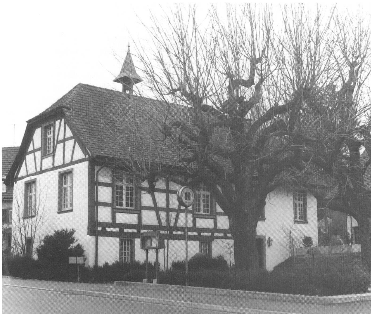
Bild 5. Begegnungszentrum Spritzehüsli heute.