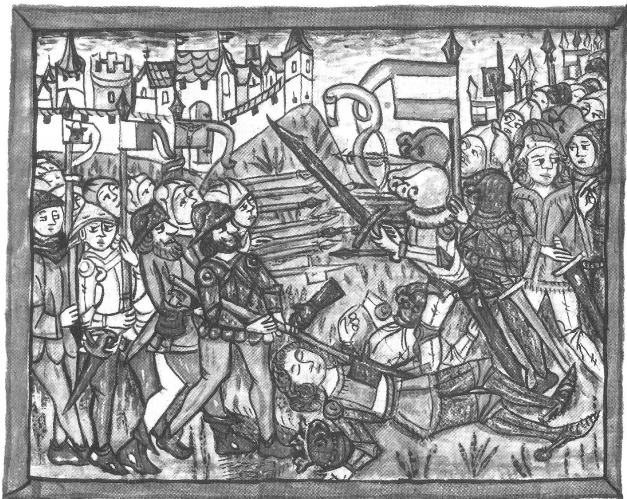
Bild 1. Der Tod Herzog Leopolds. Darstellung der Schlacht bei Sempach, ca. 1440, im Codex Man.A 45, Stadtbibliothek Bern.

In Diebold Schillings Luzerner Chronik, aber auch in vielen anderen Chroniken werden die Namen der teilnehmenden Ritter und Edelknechte erwähnt, die im Kampf gefallen sind. Darunter finden wir auch Namen aus unserer Gegend.