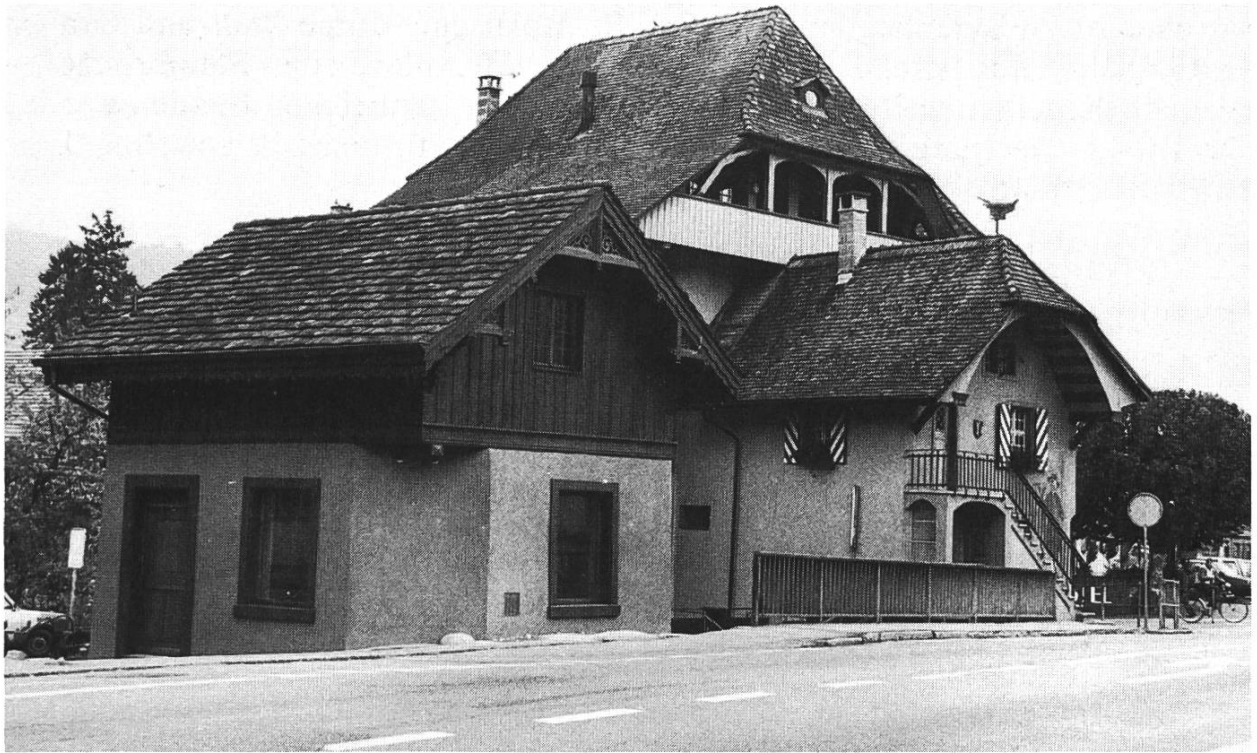
Bild 2. Sissach. Schlachthäuschen (School) und Wacht, dahinter das «alte Konsum» mit Krüppelwalm und Laube.

Sissach, altes Schlachthüsli. Bei der Renovation und dem Umbau dieses Gebäudes wurde das unter dem Fussboden liegende ehemalige «Prison» wieder freigelegt. Im Einfüllschutt fanden sich zahlreiche Funde aus der Zeit von 1900. Nach der Freilegung zeigte sich, dass das Schlachthüsli an das Widerlager der Brücke über den Diegterbach angebaut war; es kann somit frühestens aus dem späten 18. Jahrhundert stammen.