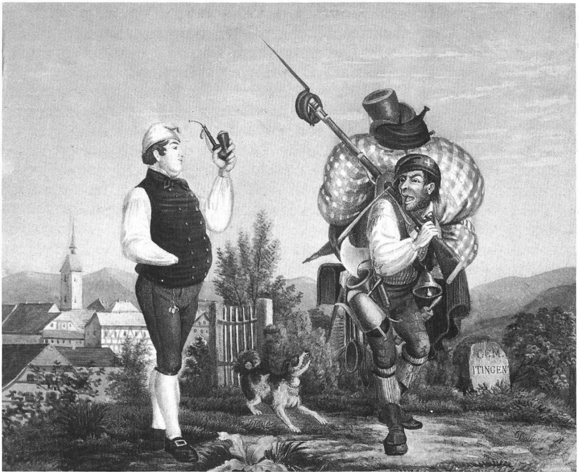
Bild 3. Nach dem Gelterkinder-Sturm. Aufschrift: «He Nochber! s het schynts wohl usgeh dört obe?» — «Me mues si ämmel wehre für sy grächti Sach!» Kolorierte Lithographie von Adolf Doudiet (1807—1872).

Soldaten gelegt, und der Beschädigte erhielt am meisten, so war besser gelitten und geschwiegen».