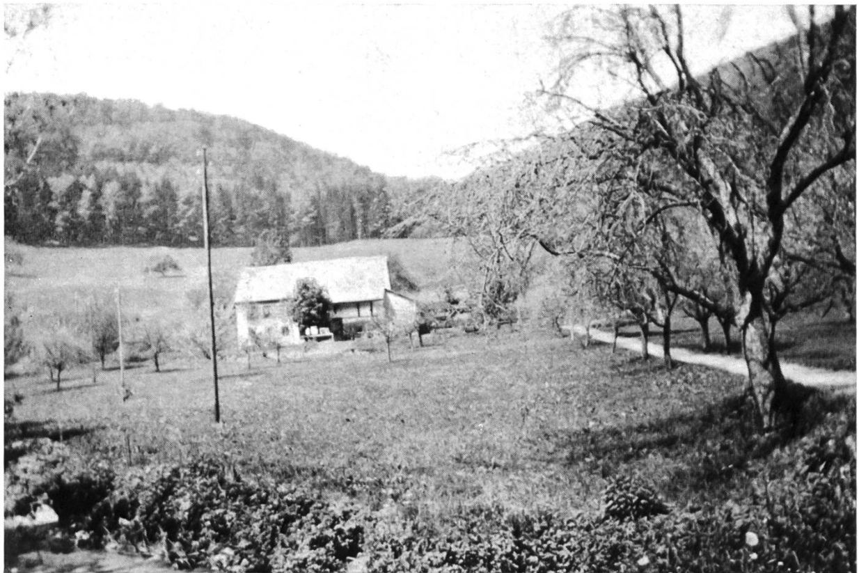
Bild 1. Gesamtansicht des Hofes Fraumatt bei Ziefen vor dem Abbruch (1977). Blick gegen Westen, im Vordergrund Hintere Frenke und Zufahrtsweg zum Hof.