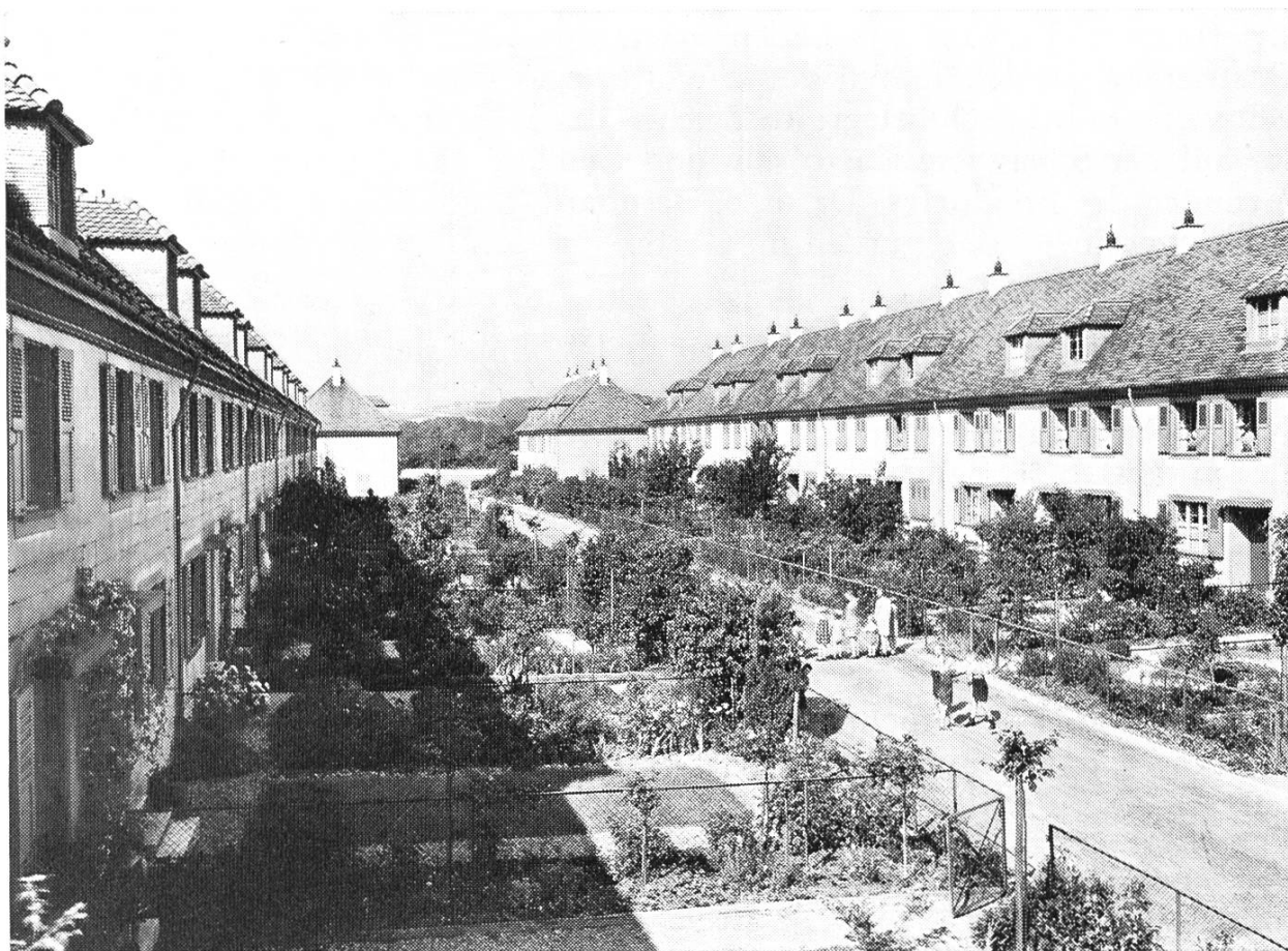
Bild 2. Eine Strasse im Freidorf, 1935.