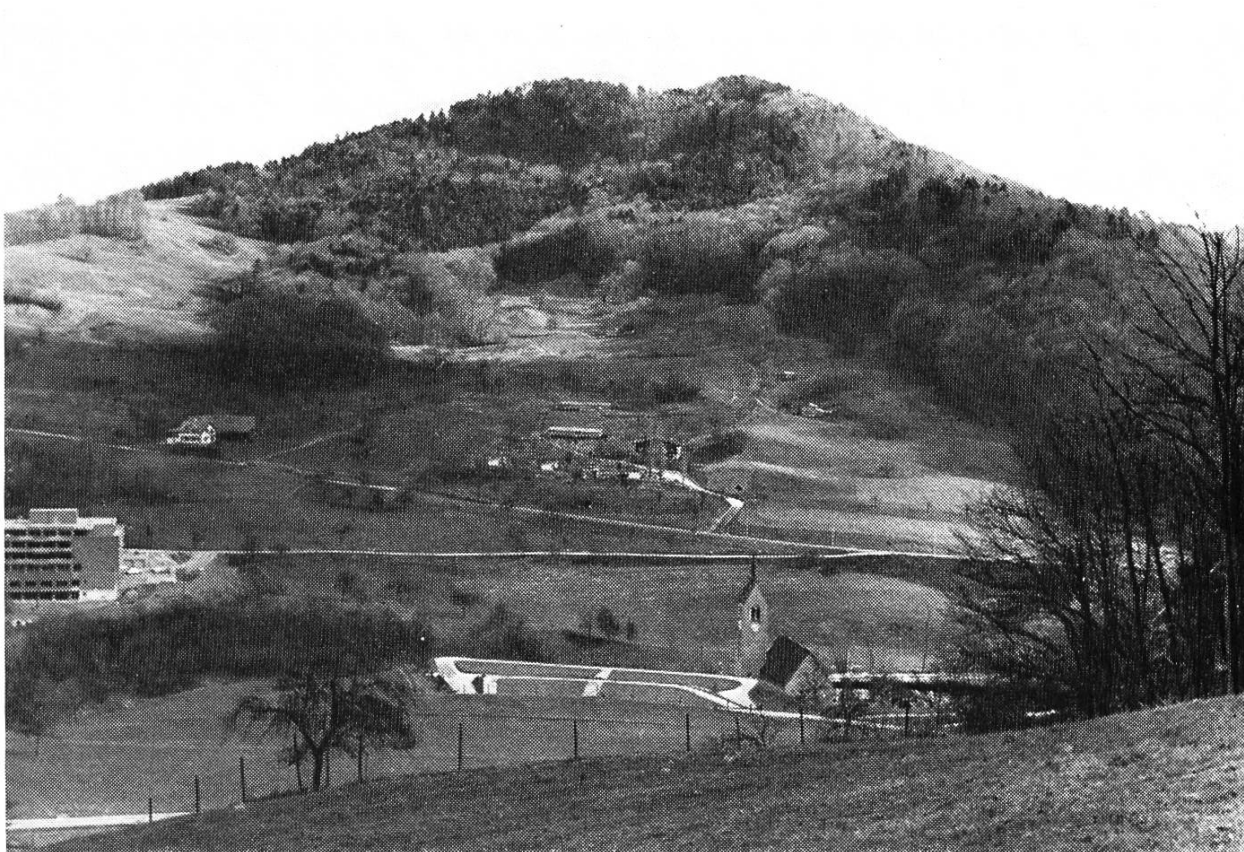
Bild 1. Kirche St. Peter, Altersheim Gritt und Nordwestseite des Dielenberges. Photo Peter Suter, 1977.