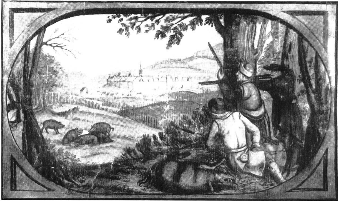
Bild 1. Ausschnitt aus G. F. Meyers Karte des Liestaler Amtes, 1679/80. Jagdszenen mit dem ummauerten Städtlein Liestal im Hintergrund, von Norden gesehen. Unteres Tor mit Brücke, links Ziegeltürmlein, rechts Pulverturm. Vor dem Städtlein Gstadig und Ergolzbrücke.

Wenden wir uns den alten, historisch gewordenen Städten zu. Die Römerstadt Augusta Raurica breitete sich in geschützter Lage auf dem Terrassensporn zwischen Ergolz und Fielenbach aus. Sie beherrschte aber auch die Strassen längs des Rheintales, die Juraübergänge Bözberg und Hauenstein und die Brücke über den Rhein. Sie war in Kriegszeiten ein wichtiger Stützpunkt, zugleich aber auch die wirtschaftliche und kulturelle Kapitale der Colonia Augusta Raurica .