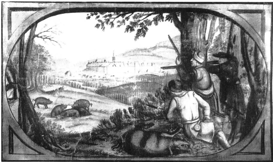
Bild 1. Ausschnitt aus G. F. Meyers Karte des Liestaler Amtes, 1679/80. Jagdszenen mit dem ummauerten Städtlein Liestal im Hintergrund, von Norden gesehen. Unteres Tor mit Brücke, links Ziegeltürmlein, rechts Pulverturm. Vor dem Städtlein Gstadig und Ergolzbrücke.

Wenden wir uns den alten, historisch gewordenen Städten zu. Die Römerstadt Augusta Raurica breitete sich in geschützter Lage auf dem Terrassensporn zwischen Ergolz und Fielenbach aus. Sie beherrschte aber auch die Strassen längs des Rheintales, die Juraübergänge Bözberg und Hauenstein und die Brücke über den Rhein. Sie war in Kriegszeiten ein wichtiger Stützpunkt, zugleich aber auch die wirtschaftliche und kulturelle Kapitale der Colonia Augusta Raurica.