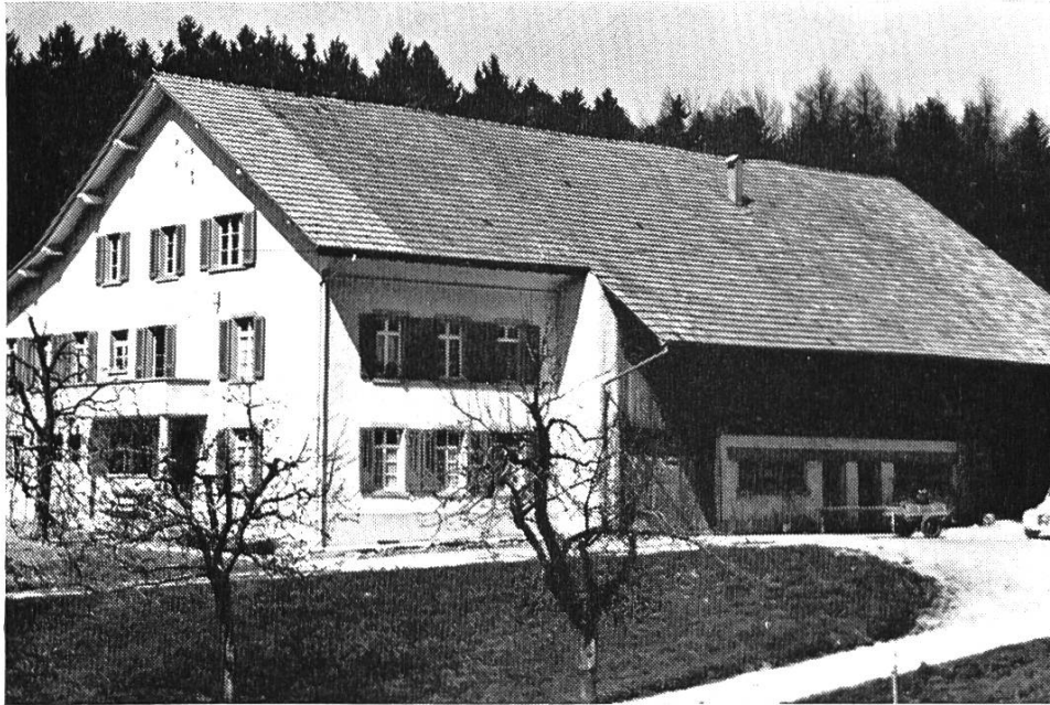
Bild 4. Junkerschloss bei Hemmiken. Gepflegter Einzelhof aus dem 19. Jahrhundert (gegründet 1817), Familienbesitz von † a. Regierungsrat M. Kaufmann. Typus des quergeteilten Einhauses mit Eingang auf der Giebelseite. Aus Peter Suter, Die Einzelhöfe von Baselland. QuF 8, Abb. 42.

die Saline). Selbst in kleinen Plateaugemeinden in guter Wohnlage sind neue Wohnquartiere entstanden, z. B. in Lupsingen (gegen Remischberg), Seltisberg (gegen Liestal), Ramlinsburg (Niederhof, Zelgli), Arboldswil (Geren, Hooland).