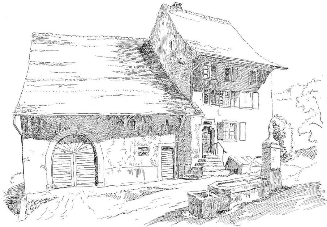
Bild 4. Dreigeschossiges, restauriertes Haus Nr. 74, rechtwinklig zur Hauptstrasse. Scheune mit Rundbogentor und Baudatum HM 1792. Davor Brunnen mit geschweiffter Spitze und Eichel, datiert 1835. — Diese Zeichnung ist unvollendet: Es fehlt ein Fenster im Erdgeschoss.