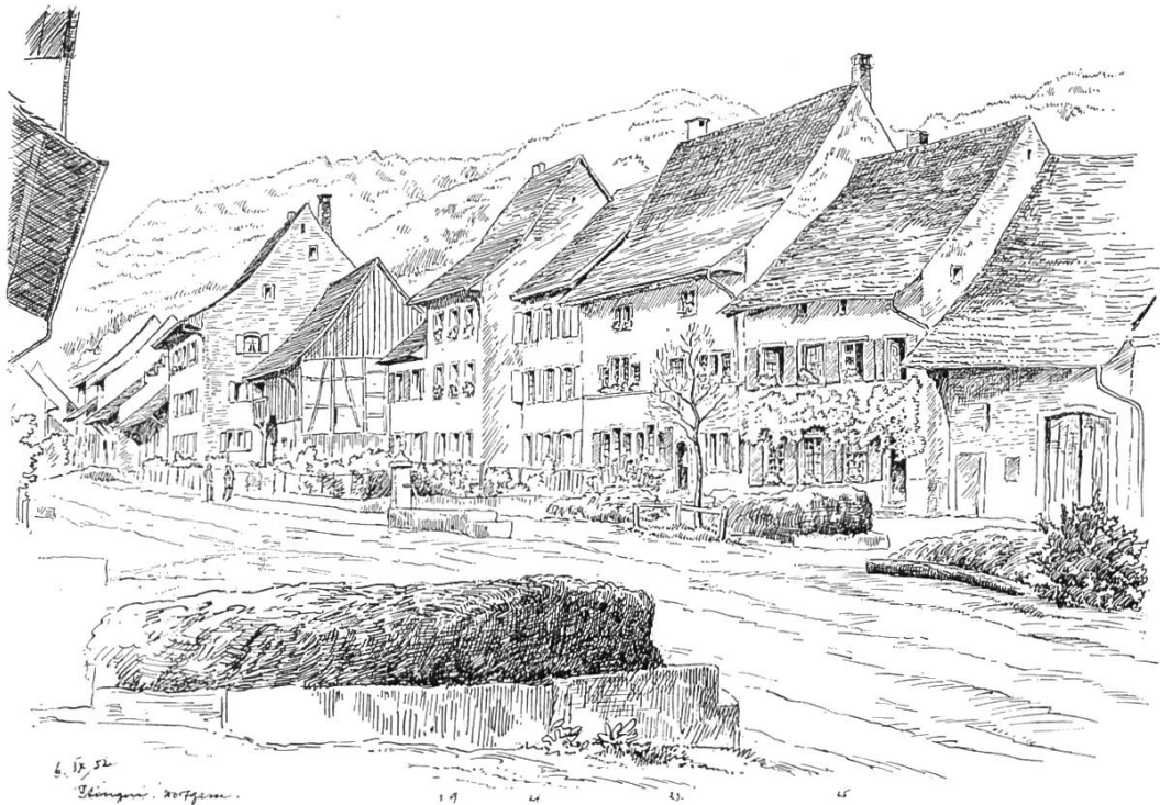
Bild 1. Westliche Seite der Dorfstrasse. Häuser Nr. 9 bis 25. Der Miststock im Vordergrund ist heute verschwunden. Nach einer Federzeichnung von C. A. Müller, 1952.

stammt wohl vom Banne des abgegangenen Dorfes Itkon, der unter die Dörfer Sissach und Itingen aufgeteilt worden ist.