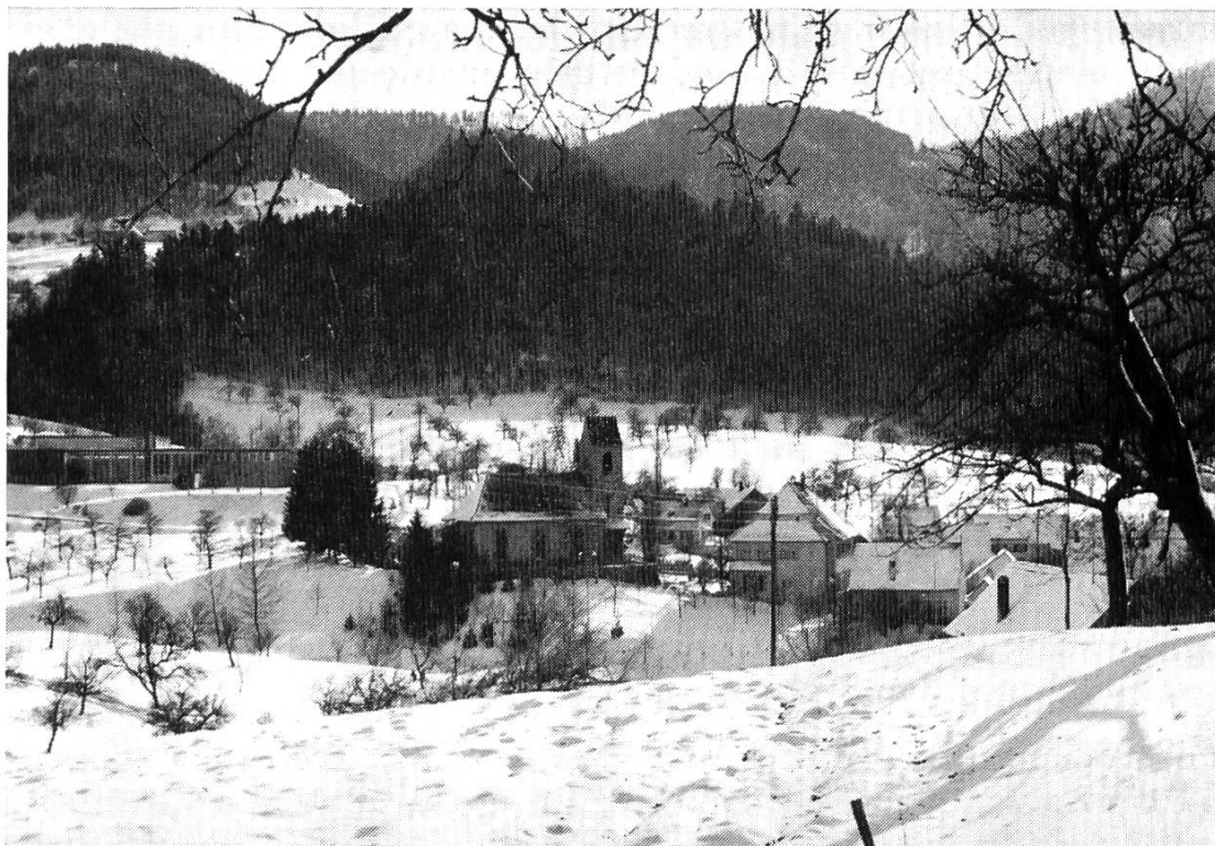
Bild 1. Blick von Norden auf das Baumgartenland. Im Hintergrund Kirche, darüber Ruine Ramstein.