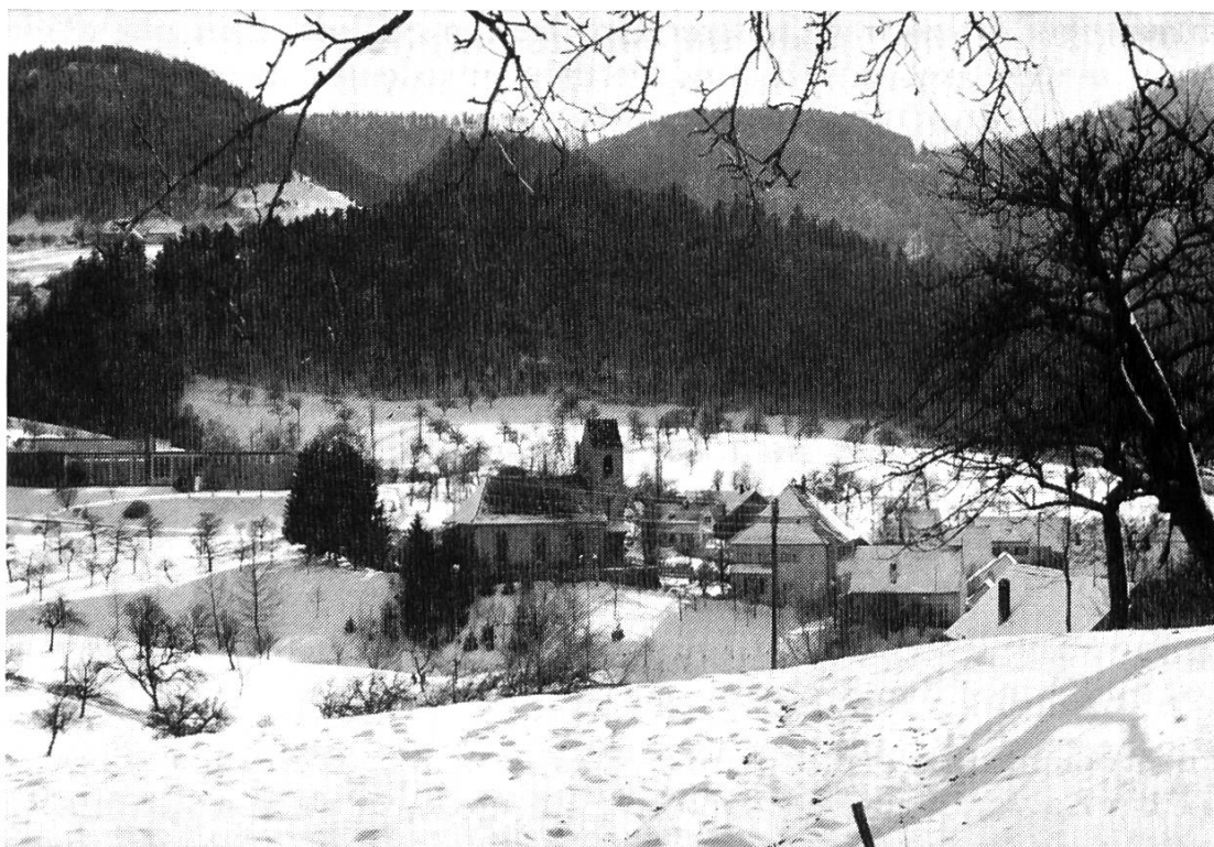
Bild 1. Blick von Norden auf das Baumgartenland. Im Hintergrund Kirche, darüber Ruine Ramstein.