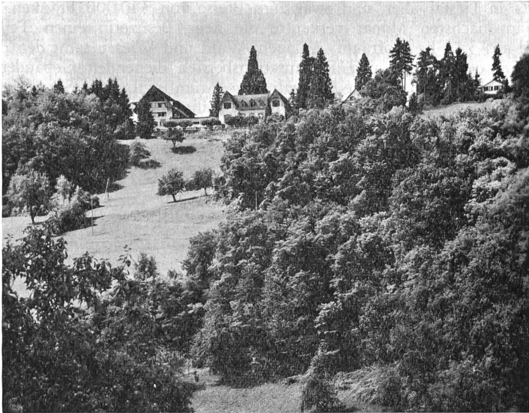
Bild 2. Der Binenberg (Bienenberg) von Nordosten.

gen jüdische Flüchtlingsfrauen ein, vor allem werdende Mütter. Ihnen folgten russische Flüchtlingsfrauen und schliesslich konnten sich bis 1948 kriegsgeschädigte Auslandschweizerfamilien auf dem Binenberg erholen.