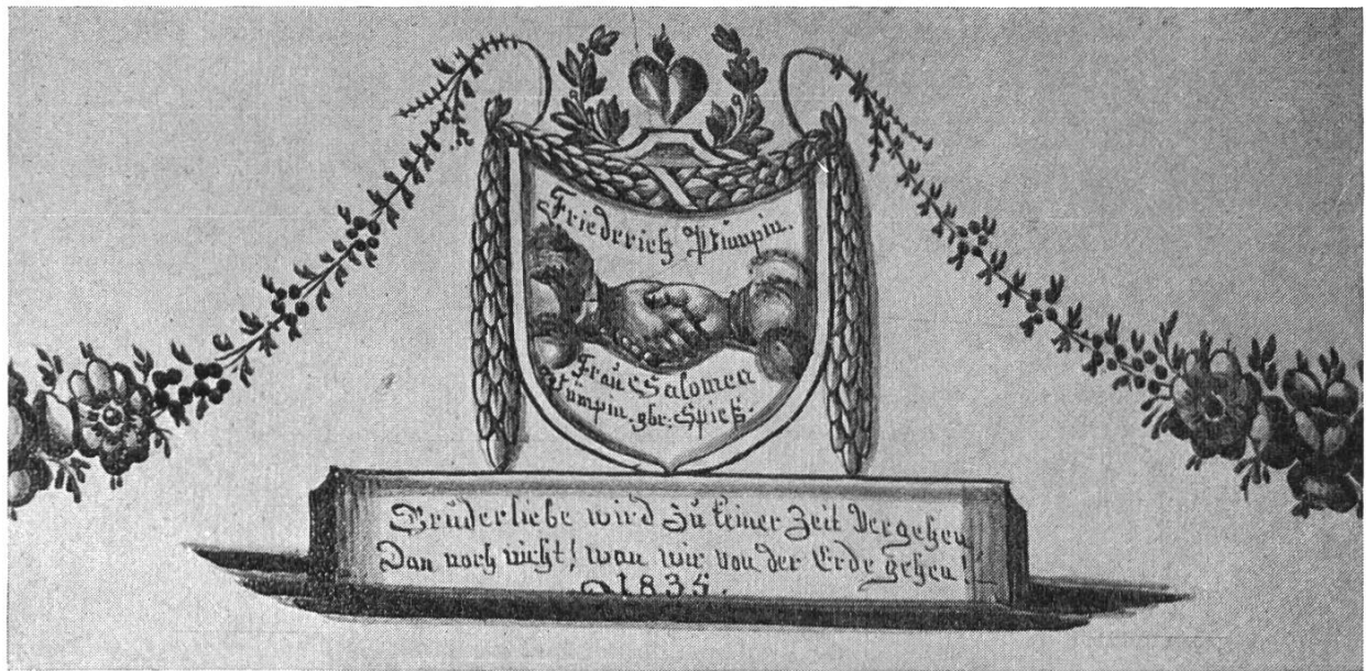
Bild 1. Widmungs-Ofenkachel vom Gasthaus zum Ochsen in Gelterkinden, nun im Haus von Fritz Pümpin-Gerster, Rickenbacherstrasse 2, Gelterkinden.

Gute Bürger in jedem Stand Sind treue Freunde am Vaterland.