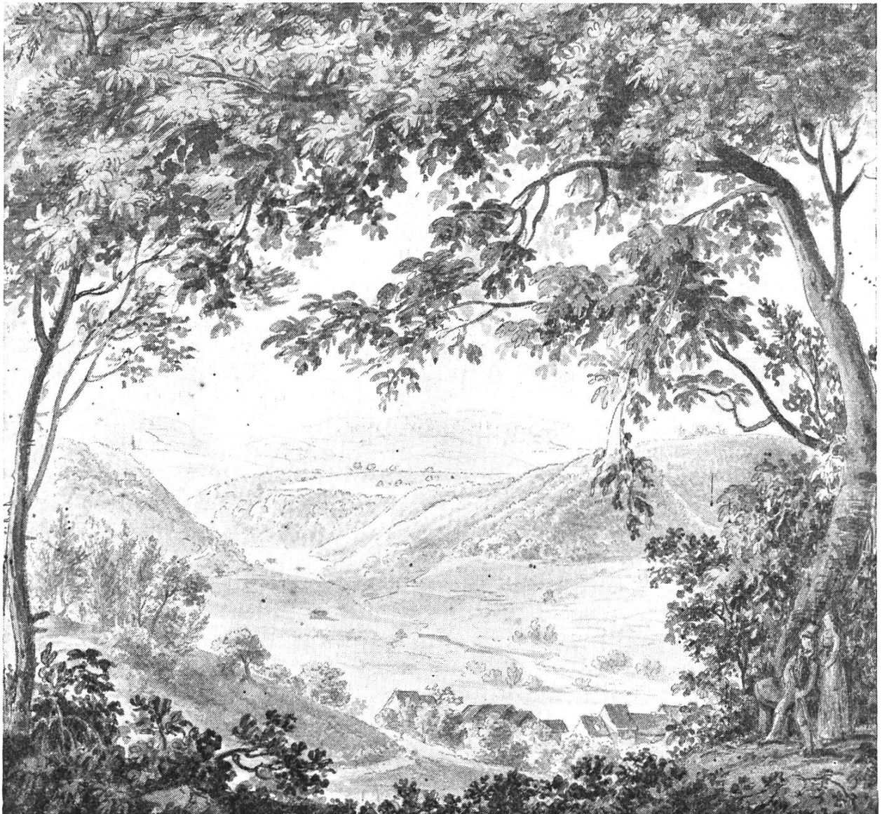
Bild 1. Eital mit Tecknau . Aquarell eines Anonymus, 18,5 mal 17,1 cm, im Kantonsmuseum Liestal. Blick vom Chueni südlich Ärntholden. Im Mittelgrund Tecknau und Eital (talaufwärts), links Oedenburg, rechts Hochebene von Hinterholz und einige Häuser von Rünenberg. Im Hintergrund in schwachen Umrissen: Zigflue, Sodchopf, Burgflue.

von der Kirche mit dem mächtigen Käsbissenturm. In den letzten Jahrzehnten hat sich das Dorf an den Aussenseiten durch Wohn- und Industriequartiere stark erweitert; auch der Bau der neuen Hauensteinlinie mit ihren Aufschüttungen und Einschnitten hat die orographischen Verhältnisse der Umgebung augenfällig verändert.