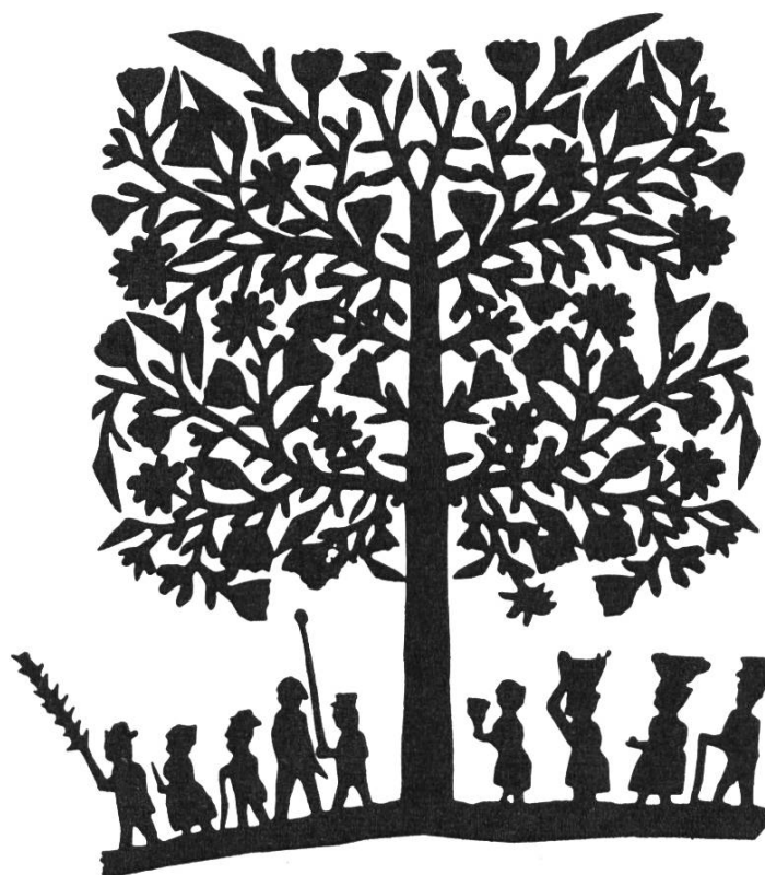
Bild 3. Blütenbaum (Faltschnitt) und ländliche Figuren (Scherenschnitt).