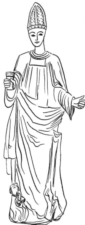
Bild 3. Statue des hl. Remigius (16. Jh.) in der Pfarrkirche von Weiler bei Rottenburg. Aus Braun J., a.a.O. S. 626, Abb. 338.

beigebracht worden sei. Remigius starb hochbetagt um 534. Durch den Einfluss der fränkischen Glaubensboten wurde die Verehrung des hl. Remigius auch in Alemannien volkstümlich. In der Diözese Reims wird der Namenstag am 13. Januar, seinem Sterbetag, gefeiert, sonst aber meistens am 1. Oktober, dem Jahrestag der Uebertragung seiner Leiche in die Krypta der Kirche des hl. Christophorus. Attribute: Bischofstracht, mit Salbfläschchen, mit Taube, welche Salbfläschchen herbeibringt, zu Füssen des Heiligen König Chlodwig 6 .