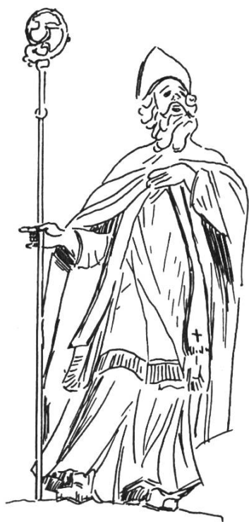
Bild 2. Statue des hl. Hilarius aus der Kirche von Holderbank SO (18. Jh.). Merkwür- digerweise haben sich von diesem in altchristlicher Zeit hoch verehrten Heiligen keine Denkmäler aus früherer Zeit erhalten. Aus Loertscher G., a.a.O. S. 84, Abb. 90.

Remigius, der heilige Bischof von Reims und der bekannte Frankenapostel, stammte aus vornehmer, gallo-römischer Familie. 437 geboren, wurde er bereits 22jährig Bischof von Reims. Eifrig um die Bekehrung der Arianer und der heidnischen Franken sich bemühend, erhielt er geschichtliche Berühmtheit durch die Unterweisung und die Taufe des fränkischen Königs Chlodwig. An die Tauffeier knüpft sich die Legende, dass bei der Spendung der Firmung das fehlende Salbfläschchen wunderbarerweise durch eine Taube