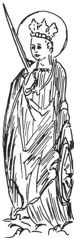
Bild 7. St. Katharina mit Schwert und Rad (15. Jh.). Aus einem Altarbild im Kloster Mariastein SO. Aus Loertscher G., a.a.O. S. 402, Abb. 425.

bau: 1185 soll das Münster einem Brand zum Opfer gefallen sein, 1193 wurde ein Marienaltar erwähnt, 1200 predigte ein Elsässer Abt den Kreuzzug «in ecclesia beate Virginis Marie», bei seiner Rückkehr 1205 stiftete er eine prachtvolle Decke auf den der Maria geweihten Hochaltar des Münsters 12 . Im 12. Jahrhundert besass der Bischof von Basel Bretzwil , dessen Kirche ebenfalls der Patronin des Münsters geweiht wurde. An diese Zeit erinnern der Flurname «unser frowen ackher» und die 1786 eingeschmolzene «Ave-Maria-Glocke» mit Datierung 1484 13 . Darstellungen: Maria mit dem Jesusknaben, Maria als Jungfrau mit Mantel, auf Mond stehend, mit Stern u. a. Mariae Geburt: 8. September, Mariae Himmelfahrt: 15. August.