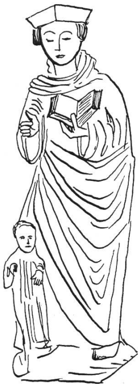
Bild 5. Statue St. Fridolin (um 1520) in der Kirche St. Michael in Kaysersberg (Elsass). Zu seinen Füßen der wieder- erweckte Ursus. Aus Braun J., a.a.O., S. 270, Abb. 135.

In unserer Gegend ist es die heute profanierte St. Fridolinskapelle im Hinter Birtis zwischen Lauwil und Beinwil 11 , wo der Heilige verehrt wurde. Attri-