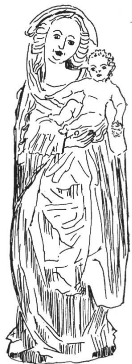
Bild 6. Statue Maria mit Kind (um 1530) aus der Pfarr- kirche Büsserach SO. Aus Loertscher G., a.a.O. S. 191, Abb. 205.

bute: Benedictiner mit Kapuze; oft ist ein Toter beigegeben (Ursus), den Fridolin nach der Legende wieder lebendig machte, damit er in einem Rechtsstreit Zeugnis ablegen konnte. Namenstag: 6. März (grosse Prozession in Säkingen).