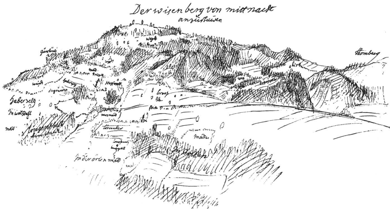
Bild 1. «Der Wisenberg von mittnacht anzuschauen». Nach einer Federzeichnung von Georg Friedrich Meyer, 1680, stark verkleinert. Meisterhaft hingeworfene Ansichtsskizze von Norden her, welche durch eine kräftige und sichere Schraffierung das Relief des markanten Berges plastisch wiedergibt.

Im 17. Jahrhundert noch siedlungsleere Landschaft. Das Waldkleid des Berges ist durch verschiedene Weiden und Matten unterbrochen, die sich auf den weniger steilen Hängen ausdehnen. Der höchste Punkt trug 1680 in der Gegend des heutigen Aussichtspunktes eine Hochwacht, welche im Alarmsystem der Landmiliz eine wichtige Rolle spielte.