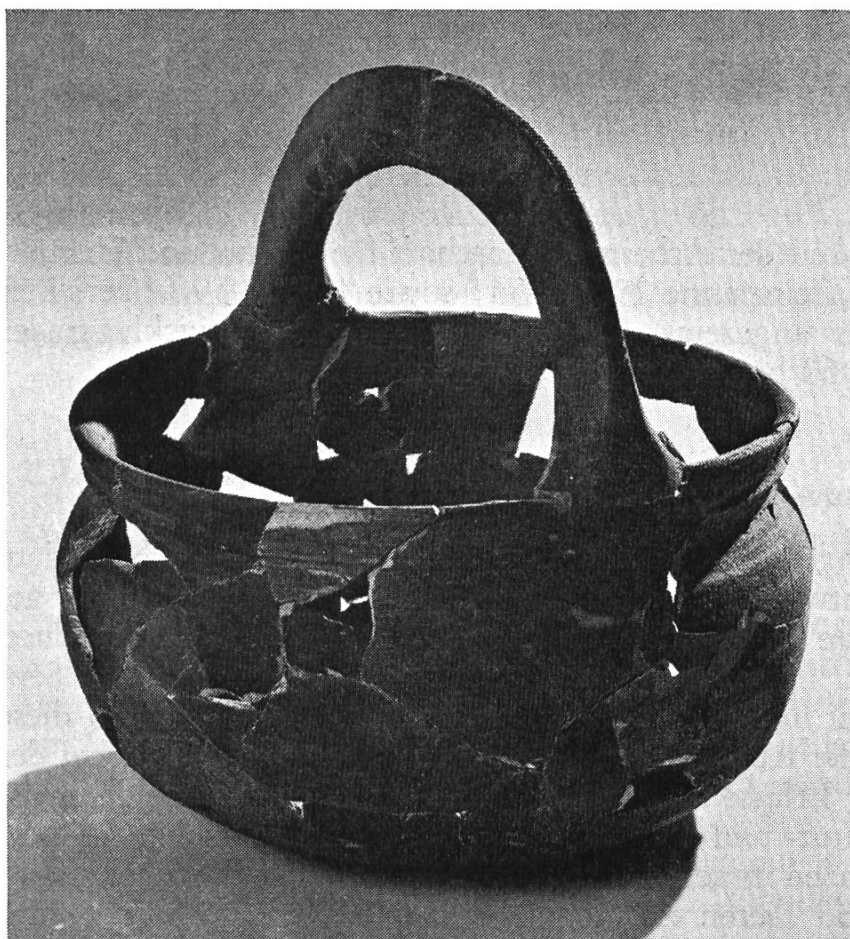
Bild 2. Henkelkrug aus grauem Ton. Durchmesser 28 cm, Höhe total 28 cm.

dung von Henkel und Topf ist nur oberflächlich. Daraus schliessen wir, dass der Henkel ein Zierelement ist und nur beschränkte Trägerfunktion hatte. Ein Henkelansatz musste zur Aufnahme ergänzt werden. Nach Beendigung der Arbeiten in diesem Bodenabschnitt wird das Originalstück, das sich sicher noch finden wird, eingesetzt. Auf Grund eines einzelnen Scherbens ist diese Form niemals zu erkennen. Selbst der Henkelansatz bricht so, dass nicht ohne weiteres auf die eigentliche Form geschlossen werden kann. So könnte es sich z. B. bei Horands Pfannenring 4 sehr wohl um ein Henkelstück eines solchen Gefässes handeln.