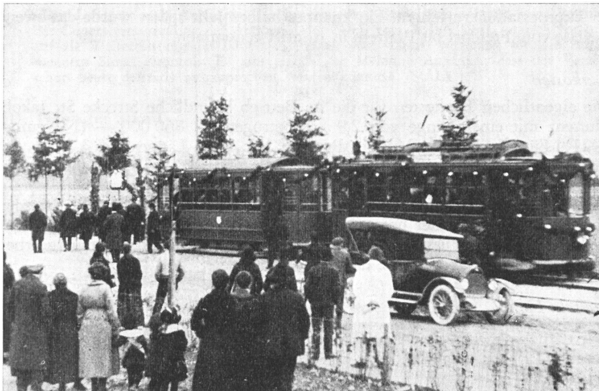
Bild 1. Eröffnung der BUeB im Freidorf, 1921

Der Bundesbeschluss vom 25. Juni 1921 erlaubte der BUeB, die zweite Sektion MuttENZ-Liestal und allenfalls MuttENZ-Neuwelt in zwei Teilen auszuführen, nämlich: