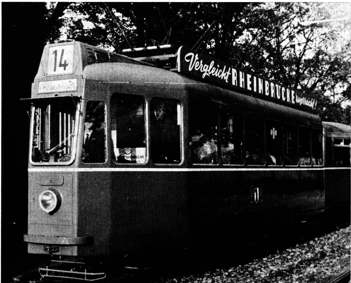
Bild 2. Tramzug 14 im Jahr 1966.