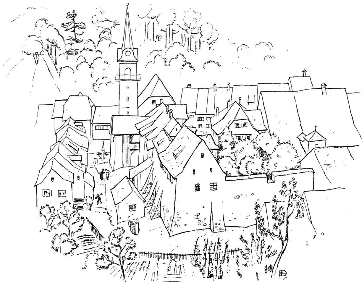
Pfarrhaus und Kirche nach einer Federzeichnung von O. Plattner, 1943. Stadtmauer beim Pfarrhaus durch Stützpfeiler verstärkt, das Pfarrhaus nach Osten erweitert. Im Graben der einstige Weiher.

Niklaus Bischoff wirkte von 1682 bis 1708 in der Kirchgemeinde und starb im Alter von 67 Jahren in Waldenburg.