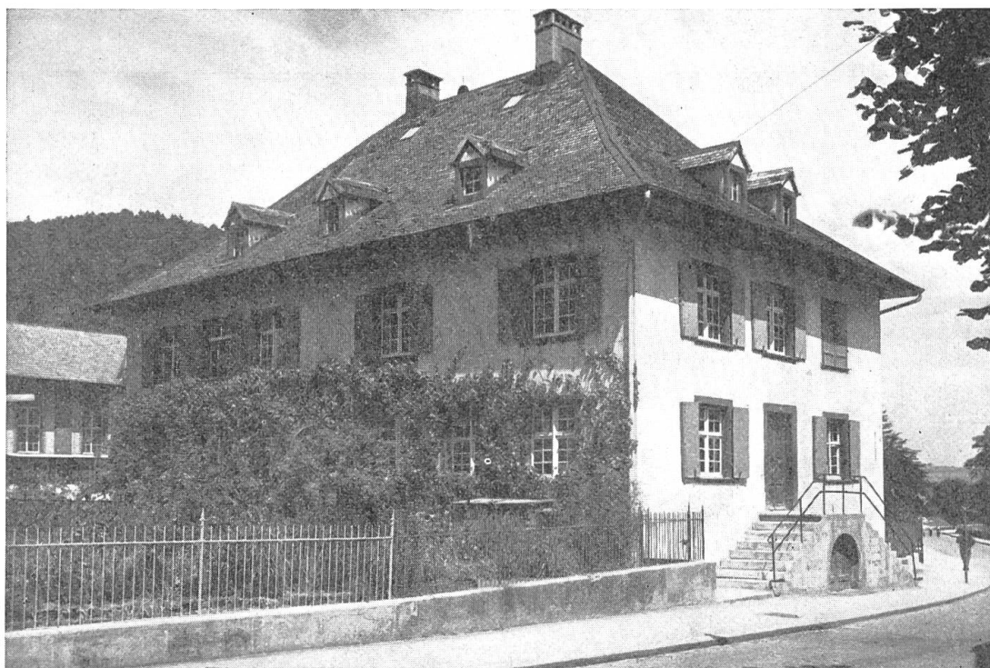
Bild 1. Becksches Haus, Bezirksschule Waldenburg, nach 1935

trug, wollte mit dem besten Willen nicht zum alten Hause passen, wenn er auch neue Räume, ein Klassenzimmer unten und einen Zeichensaal oben, erhielt und verbesserte Abortvorrichtungen brachte. Als die Bezirkslehrer im Erdgeschoss elektrisches Licht einrichten lassen wollten, fand man in Liestal, es komme zu teuer und sei in einer Bezirksschule nicht nötig! Doch siegte zuletzt der Fortschritt, als die Elektra Baselland für die 5 (!) Lampen einen reduzierten Strompreis bewilligte. Die Raumverhältnisse blieben trotz dem Umbau beschränkt, so dass die Mädchen, welche nach und nach neben den Knaben auf-