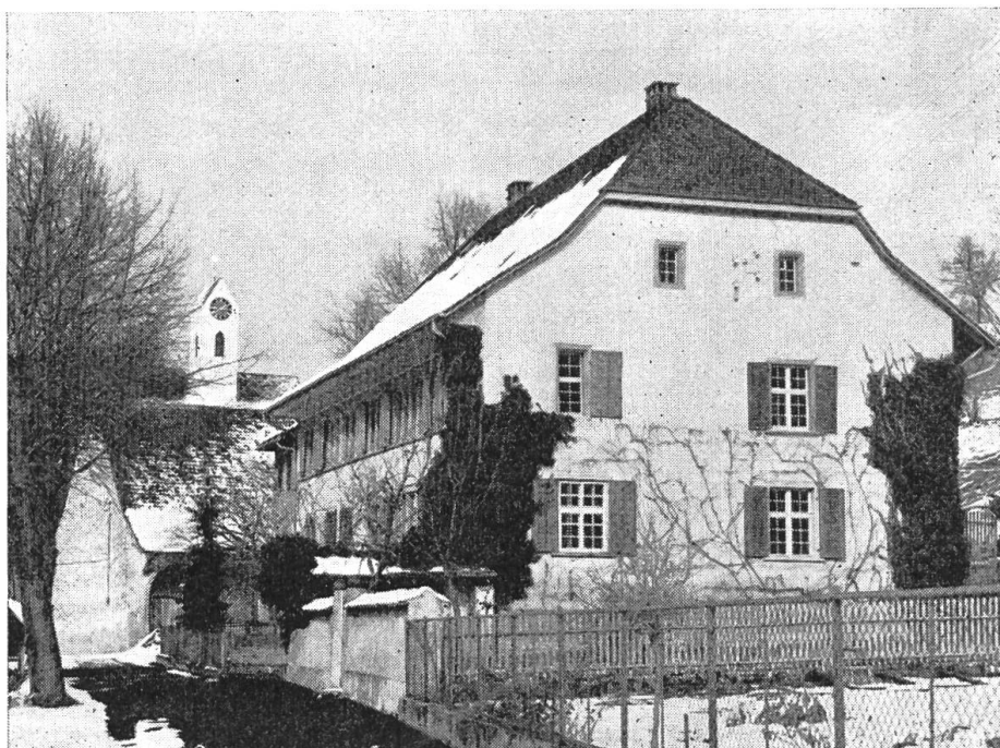
Bild 48. Pfarrhaus und Kirche von Diegten im Jahre 1965 von Süden.