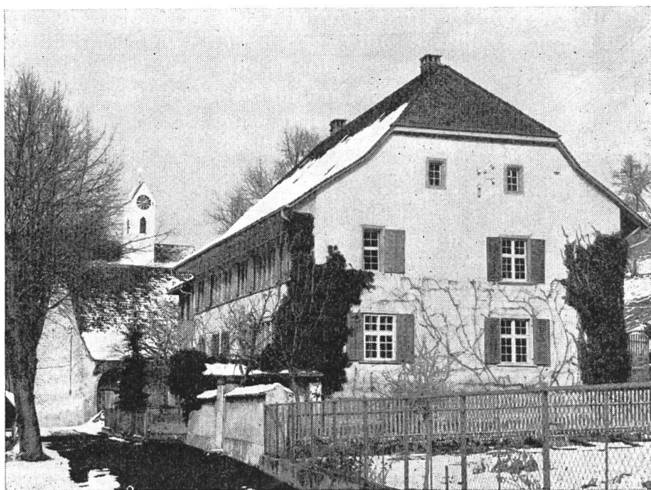
Bild 48. Pfarrhaus und Kirche von Diegten im Jahre 1965 von Süden.

Das 1704 erbaute Pfarrhaus ist auch heute noch das stattlichste Gebäude unseres Dorfes. Wer sein Baumeister war, woher er stammte, ob er vom Kloster Olsberg oder von Pfarrer Brenner beigezogen wurde, ist nicht bekannt. Die Fenster sind zwar noch gotisch; doch sonst weist das Pfarrhaus schon stark die Merkmale des Barocks auf. Die gegen die Strasse gerichtete Fassade ist streng symmetrisch, das Hauptportal in der Mitte; die dazu hinaufführende Treppe war ursprünglich ebenfalls symmetrisch angelegt. In beiden Geschossen teilt ein Gang das Haus in zwei ungefähr gleichgrosse Teile. Auf der Nordseite ist