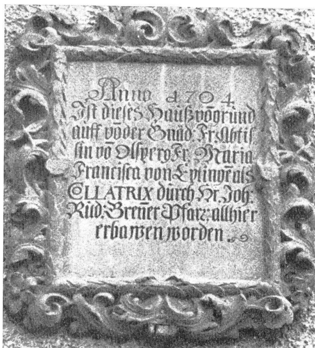
Bild 47. Bauinschrift von 1704 über der Haustüre am Pfarrhaus.