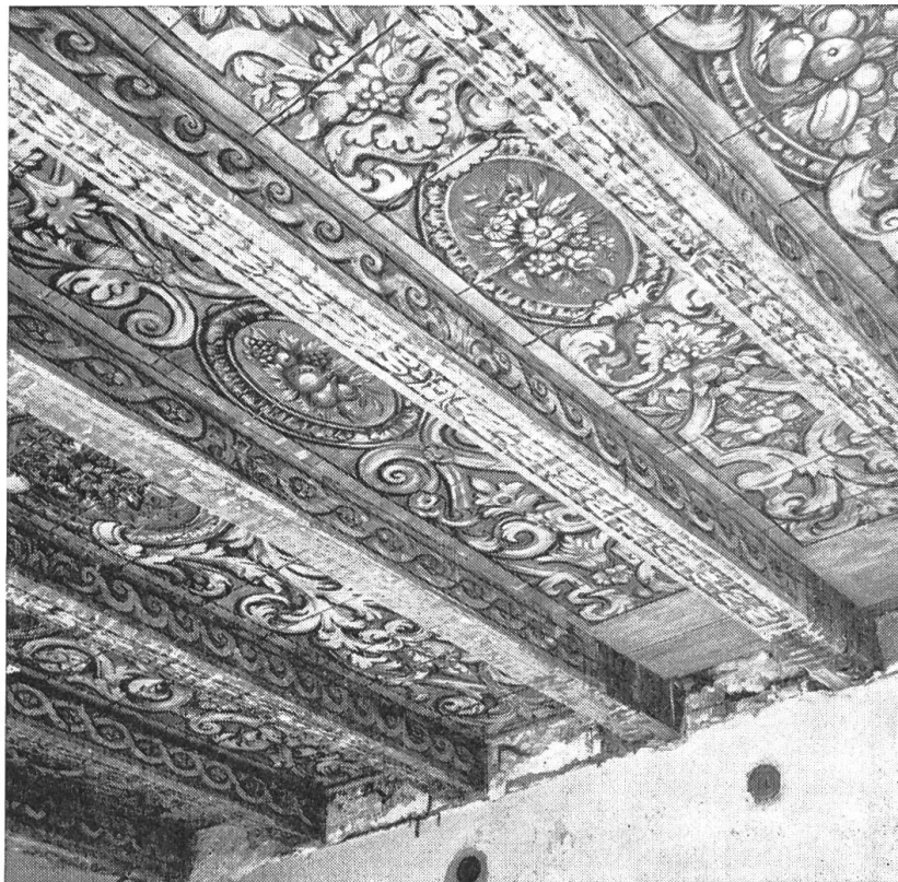
Bild 49. Gemalte Decke im «Pfarrsaal». Sie kam 1963 während der letzten Renovation des Pfarrhauses hinter einer Gipsdecke zum Vorschein; sie dürfte aus dem Jahre 1704 stammen.

Dem Kloster Olsberg scheint später nicht mehr viel am Diegter Pfarrhaus gelegen zu haben. Höchst widerwillig und nur auf starkes Drängen des Rates zu Basel hin kam es seinen Verpflichtungen in Diegten nach. So ist es nicht weiter zu verwundern, dass auch das neue wie seinerzeit die früheren Pfarr-