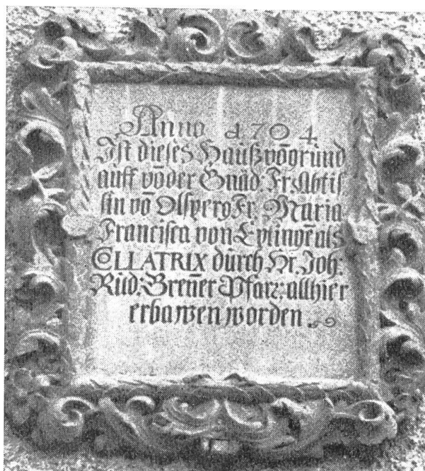
Bild 47. Bauinschrift von 1704 über der Haustüre am Pfarrhaus.