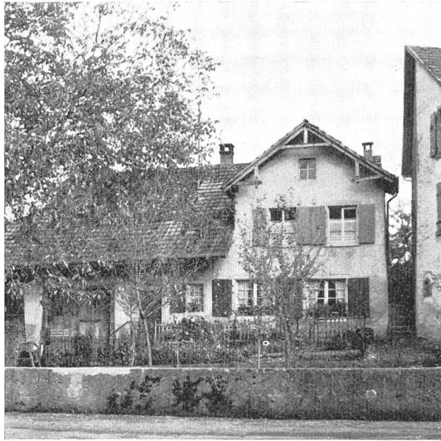
Bild 45. Das erste Schulhaus von Diegten. Es wurde 1710 in Schlossdiegten erbaut und diente der Schule bis 1782. Die beiden grossen Fenster der ehemaligen Schulstube sind gut erkennbar. (Die Aufstockung darüber ist modern.)