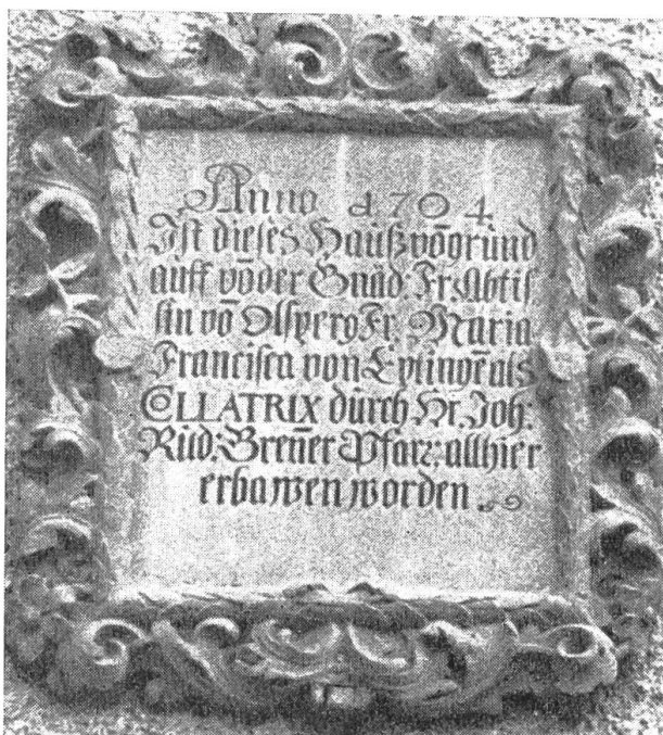
Bild 47. Bauinschrift von 1704 über der Haustüre am Pfarrhaus.