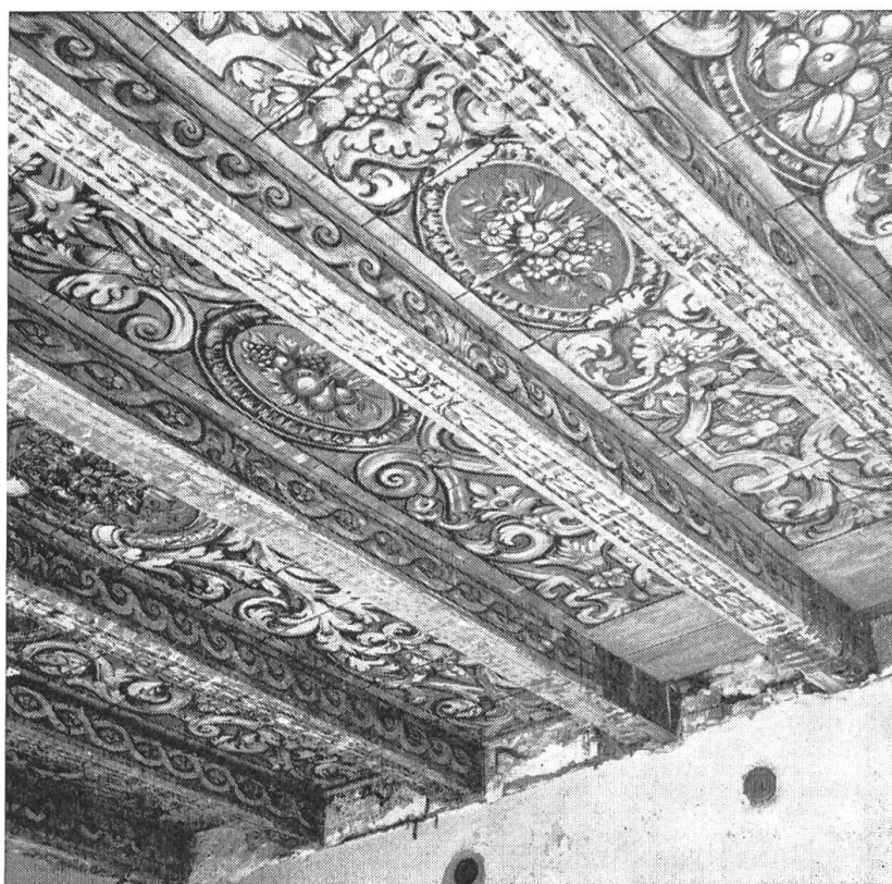
Bild 49. Gemalte Decke im «Pfarrsaal». Sie kam 1963 während der letzten Renovation des Pfarrhauses hinter einer Gipsdecke zum Vorschein; sie dürfte aus dem Jahre 1704 stammen.

Dem Kloster Olsberg scheint später nicht mehr viel am Diegter Pfarrhaus gelegen zu haben. Höchst widerwillig und nur auf starkes Drängen des Rates zu Basel hin kam es seinen Verpflichtungen in Diegten nach. So ist es nicht weiter zu verwundern, dass auch das neue wie seinerzeit die früheren Pfarr-