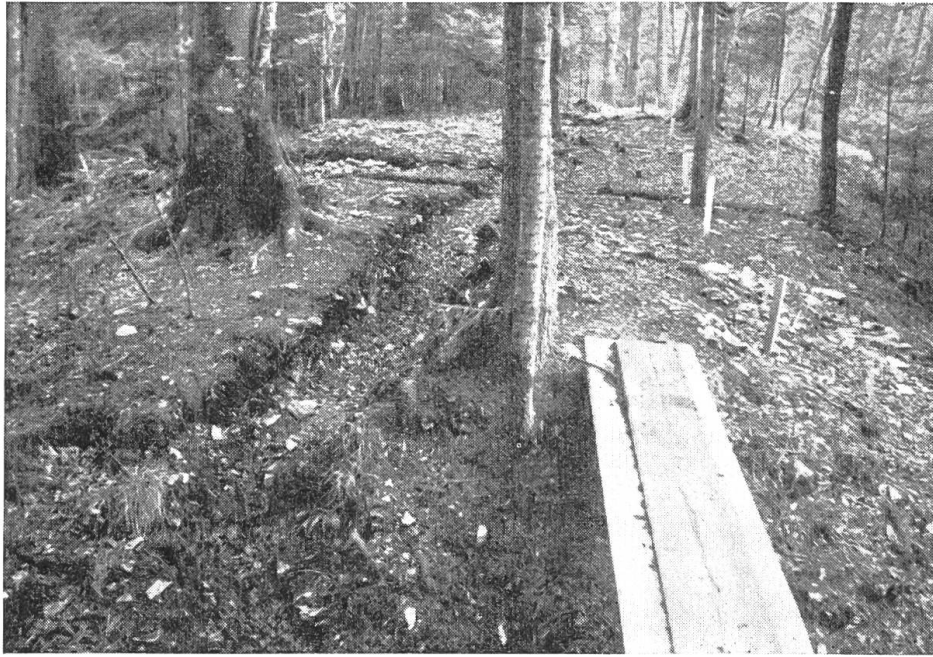
Bild 2. Das flache Hügelplateau „Alt Schloss“, aufgenommen vom Halsgraben, von Westen her. Masse der vermutlichen Fluchtburg 28 mal 12 m, Fläche ca. 3,5 a