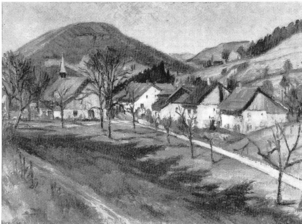
Bild 2. Bärenwil mit Wannenfliue gegen Westen. Nach einem Oelbild von Albert Schweizer, im Besitz des M. Disteli-Museums in Olten. Photo Rubin, Olten.

gemässen Methoden wirtschaftenden Hofbauern und Pächter der Herrengüter sind in etlichen Genossenschaften und im Bergbauernverein organisiert und arbeiten in den verschiedenen Behörden eifrig mit zum Wohle des dörflichen Gemeinwesens.