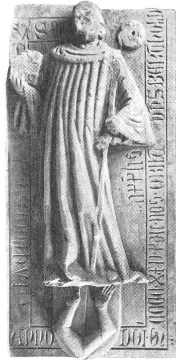
Bild 4. Sarkophag in der Johanneskapelle des Klosters Allerheiligen zu Schaffhausen. Das Bild zeigt die Deckplatte mit dem Halbrelief des Abtes Berthold von Sissach, zu seinen Füßen das Wappen der von Sissach. Inschrift: Anno Domini MCCCCXXV, pridie nonas aprilis, obiit Dominus Bertholdus de Syssach, abbas monasterii hujus.