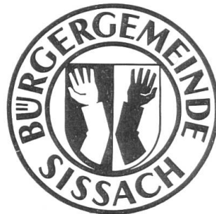
Bild 6. Gemeindestempel von Sissach. Fassung O. Plattner und A. Zehntner, 1945.

erwähnten Schaffhauser Vertreter von der sonst später üblichen Form etwas abweicht, indem dort die Ellbogen der Arme nach auswärts, bei den andern Wappendarstellungen aber nach einwärts gekehrt sind. Es dürfte sich hier wohl um eine Eigentümlichkeit dieser einzelnen Familienzweige handeln, die weiter keine Bedeutung hat. Auf alle Fälle finden wir sonst das Wappen immer mit nach innen gekehrten Ellbogen abgebildet. Die übrigen Verschiedenheiten, wie Ansicht der Hände von innen oder aussen, d. h. mit Darstellung von Handfläche oder Handrücken, sowie die Verzierung der Aermel mit drei und mehr Knöpfen oder «Rollen» sind ebenfalls ohne Belang.