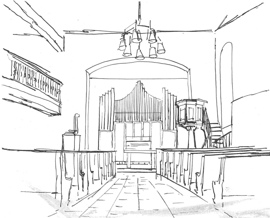
Bild 3. Kirche Buus. Blick auf den Chor mit neuerstelltem Chorbogen und Orgel. Heutiger Zustand. Nacher einer Federzeichnung von Walter Blapp.

siger Genossenschaften, der Einwohnerschaft und zahlreicher auswärtiger Bürger nach einem von Gemeindepräsident A. Buess ausgedachten Plane aufgebracht. Die Kosten der durch das Baugeschäft Herzog in Gelterkinden durchgeführten Entfeuchtungs- und Isolierarbeiten beliefen sich auf Fr. 14 355.—, die der Innenrenovation auf Fr. 20 775.—. In diesen Beträgen sind einige Posten, die ganz von der Gemeinde Buus zu tragen waren, nicht enthalten (Leuchter, Läufer, usw.). In einer gemeinsamen Sitzung (1. September 1945) einigten