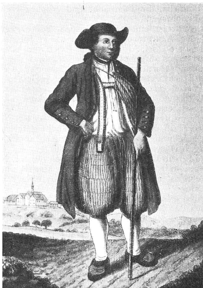
Bild 8. Bauer aus der Landschaft Basel, im Hintergrund St. Margarethen. Nach einer Zeichnung von Chr. von Mechel (1737—1817).

Der südliche, flache Plateauteil des Parkes ist Mattland . Auf diesem wurde 1928 die Meteorologisch - Astronomische An-