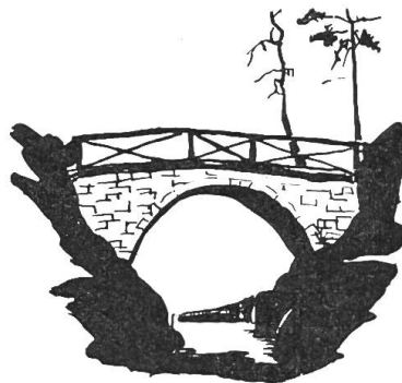
Bild 7. Teufelsbrücklein im Margarethenpark. Nach einer Federzeichnung von Peter Suter.

Von den 44 ha, die die Stadt damals erworben hat, fallen 12 ha auf den eigentlichen Park, d. h. auf das Gebiet innerhalb der Gundeldingerstrasse, Friedhofstrasse, Venusstrasse und des Unteren Batterieweges.