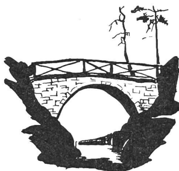
Bild 7. Teufelsbrücklein im Margarethenpark. Nach einer Federzeichnung von Peter Suter.

Von den 44 ha, die die Stadt damals erworben hat, fallen 12 ha auf den eigentlichen Park, d. h. auf das Gebiet innerhalb der Gundeldingerstrasse, Friedhofstrasse, Venusstrasse und des Unteren Batterieweges.