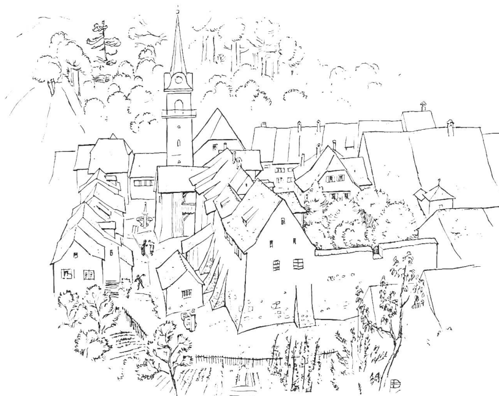
Bild 4. Partie aus dem Uhrmacherstädtchen Waldenburg.

schen ins Waldenburgertal, 25 aus Liestal, je einer aus Lausen, Giebenach und Augst, drei aus Arisdorf und sechs aus Füllinsdorf-Frenkendorf, drei aus Lupingen. Dann aus den übrigen Ortschaften der nahegelegenen Täler: Aus Seltisberg und Ziefen und natürlich auch aus Ramllinsburg, einem Ort, der 1870 noch 100 Webstühle besass und gewerblich so stark verarmte, dass zu unserer Zeit (1948) nur noch acht Webstühle dort standen. Wirklich, die Uhrenindustrie hat eine grosse wirtschaftliche Anziehungskraft bewiesen. Es besteht