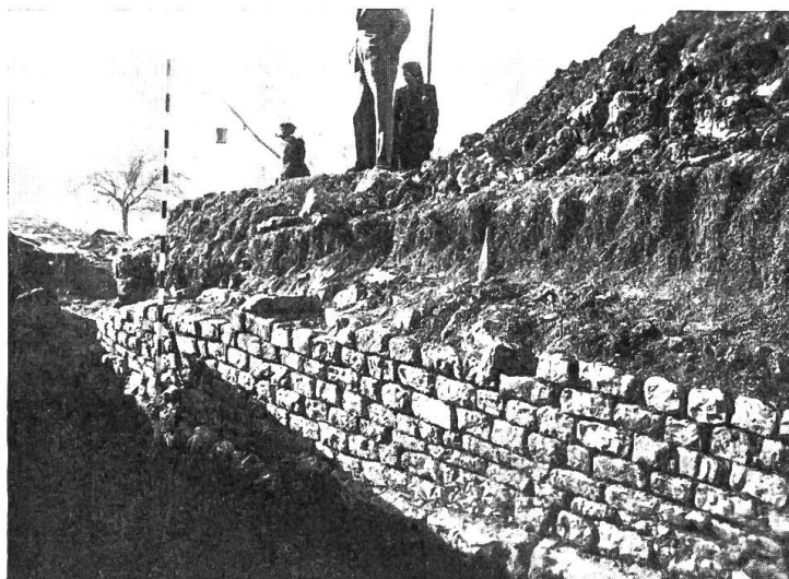
Bild 2. Ansicht der Mauer von Südosten.

Die Oberkante der angetroffenen Mauer lag nur etwa 40 cm unter der heutigen Oberfläche. Was lag näher, als die Mauer ein Stück weit zu verfolgen, an einer weitem Stelle wieder anzuschneiden, wiederum zu verfolgen, eine Mauerecke zu finden, und so nach und nach den oberflächlichen Grundriss des römischen Baues herauszubringen? Aber leider erwies sich dieser Arbeitsplan bald als undurchführbar. Wohl gruben wir der Mauer nach, suchten sie weiter oben wieder, aber je weiter östlich wir gruben, desto tiefer versank sie in der überlagernden mächtigen Lehmschicht. Dieser Teil der römischen Ruine wurde also nicht durch den oben erwähnten Erdschlipf be-