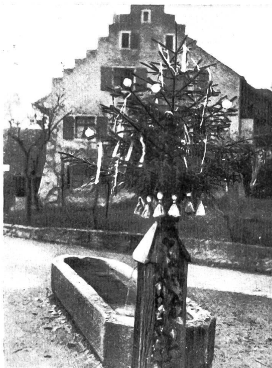
Bild 1. «Herrengassbrunnen» in Oltingen mit hölzernem Brunnenstock und Maibaum mit ausgeblasenen Eiern und Papierrosen. Photo G. Müller 1923. Aus Baselbieter Heimatbuch, Band III, Liestal 1945.

Jahrhunderts erstellt worden und zwar mit Holzdeucheln, was dann die verlockende Möglichkeit bot, die Leitung da oder dort anzubohren und für private Zwecke zu benützen. Vorgängig dieser Anlage wurde der Pfarrhof von der «Lehmattseite» her mit dem nötigen Wasser versorgt. Noch zu Anfang dieses Jahrhunderts konnte man im sog. «Summerhüsli», hart an der Landstrasse, noch deutliche Merkmale einer früheren Brunnstube erkennen. Jedenfalls wurde von diesem Wasser auch noch in den 1847 zugeschütteten Feuerweiher geleitet, aber wahrscheinlich nur zu einem kleinen Teil.