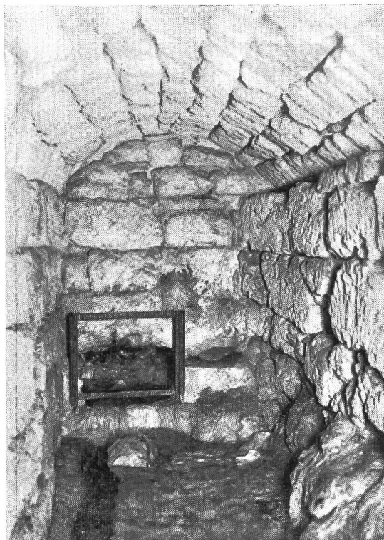
Bild 2. Das Gewölbe mit der Quellfassung der Gallislochquelle bei Oltingen.

kommen, wenn anderes, geeignetes Wasser nicht aufzufinden war. Auf Anraten von Regierungsrat Rebmann beriefen wir zuerst Dr. F. Leuthardt, Geologe in Liestal, zur Untersuchung unserer Quellenverhältnisse hieher. Es wurden besucht: Die Rötiquelle. Befund: Keine Aussicht, durch Nachgraben die nur 7 Minutenliter betragende Leistung dieser Quelle zu steigern. Auch das «Wegenstettbrünnli» zeigte das gleiche Bild. Eine weitere stärkere Quelle war uns im «Ried» bekannt und empfohlen worden. Diese tritt wenige Meter nördlich des Ergolzbächleins hart an der Grenze zwischen Gemeinde-