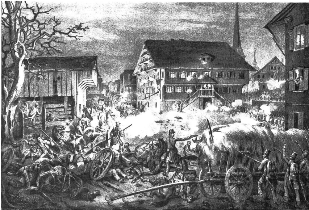
Niederlage der Freischaren bei Malters in der Nacht vom 31. März auf den 1. April 1845.

werden mussten. Es mochte nun etwa 11 Uhr nachts sein und wir befanden uns auf dem äussersten Vorposten vor dem Feinde und dessen wohlbewachter Stadt, aller Fühlung und Verbindung mit Anführer und Hauptkorps entbehrend, und sogar ohne die sonst unerlässliche Losung und Parole, so dass der Feind sich ebensogut als Freund ausgeben und uns überlisten und überrumpeln konnte, da hierfür unser Feldzeichen, eine baumwollene rot und weisse Armbinde bei finsterner Nacht zu deut-