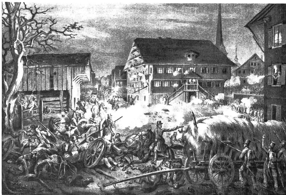
Niederlage der Freischaren bei Malters in der Nacht vom 31. März auf den 1. April 1845.

werden mussten. Es mochte nun etwa 11 Uhr nachts sein und wir befanden uns auf dem äussersten Vorposten vor dem Feinde und dessen wohlbewachter Stadt, aller Fühlung und Verbindung mit Anführer und Hauptkorps entbehrend, und sogar ohne die sonst unerlässliche Losung und Parole, so dass der Feind sich ebensogut als Freund ausgeben und uns überlisten und überrumpeln konnte, da hierfür unser Feldzeichen, eine baumwollene rot und weisse Armbinde bei finsterner Nacht zu deut-