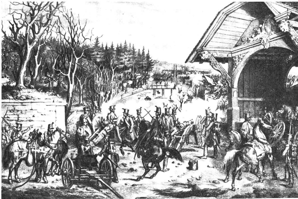
Treffen auf dem Emmenfeld am Abend des 31. März 1845. Nach einer Lithographie der Stadt- und Hochschulbibliothek Bern. Aus «Baselbieter Heimatbuch», Band III.

Vor Luzern. Wie wir aber am «Lädeli» unsere Wachtfeuer angezündet und so zahlreiche Wachtposten ringsum aufgestellt, dass kaum noch einige Mann momentan verfügbar blieben, wurde endlich auch daran gedacht, etwas Nahrung zu sich zu nehmen und bei den wackern Hausbewohnern Mehlsuppe bestellt, damit der Kehre nach je die öfters