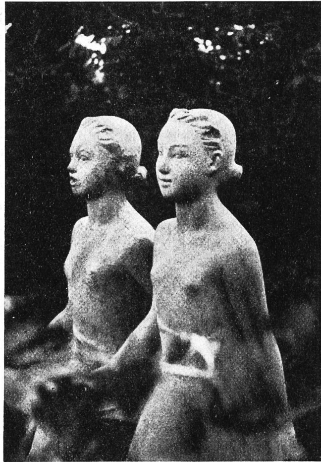
Zwei singende Mädchen, Detail, 30 F