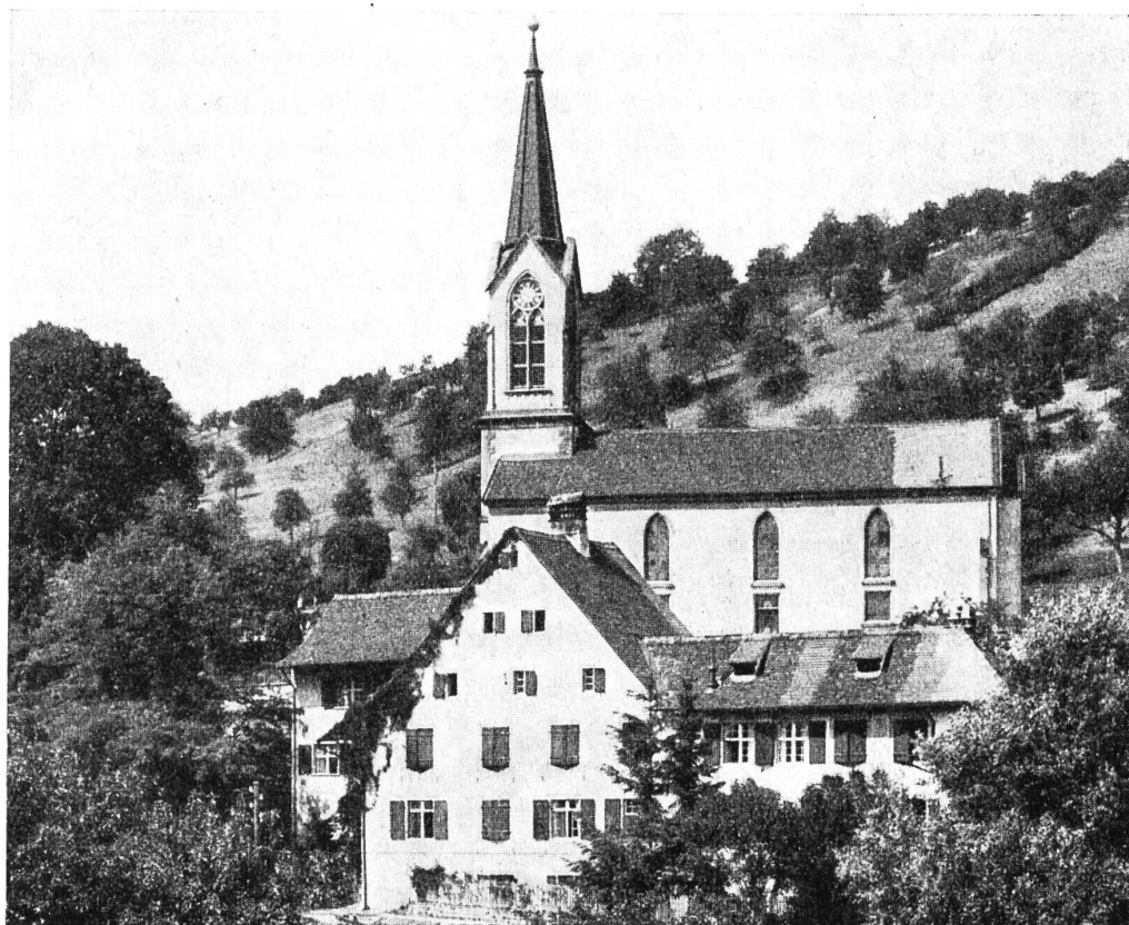
Kirche und Pfarrhaus zu Bubendorf.

angeordnet. 36) Ein geringfügiges Ereignis half mit, die Angelegenheit zu beschleunigen, ja auf ein ganz anderes Geleise zu schieben. Im Sommer 1878 sprang die grössere Glocke, so dass sie unbrauchbar wurde. Die Verwaltung erklärte sich sofort bereit, die üblichen Umgusskosten zu übernehmen oder bei der Anschaffung eines harmonischen Geläutes in der üblichen Weise beizutragen. Nun aber regte sich in der Gemeinde der Wunsch, bei Anlass der Anschaffung eines neuen Geläutes den Turm um 10 Fuss zu erhöhen. Der Bauinspektor erklärte sich mit dem Plane nach beigelegter Zeichnung einverstanden und zwar so, dass