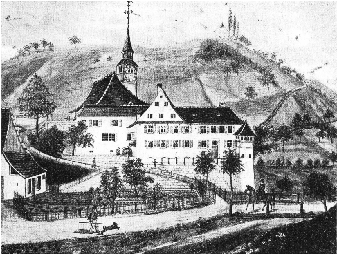
Kirche und Pfarrhaus zu Bubendorf, 1848.

Tafel zum Uhren Círcel, daran man die Stunden malt» 10 Pfund, der Maler «die Uhr samt dem Compass zu malen» 13 Pfund. 11) Im folgenden Jahre wurden dem Uhrenmacher noch einmal 39 Pfund gegeben «von der Zittglocken zu machen» und im Jahre 1578 noch einmal 6 Pfund 3 Schilling «vom vnruw Rad vnd anderem an der Uhr zu verbessern.» 1575 wurden Tücher «vber des Herrn Tisch vnd tauffstein» angeschafft, 1578 ein Fusschemel «by des Herrn tisch» und ein «Stul bim thouffstein.» 12) 1583 schenkte der neue Pfarrer Heinrich Strübin ebenso wie in Ziefen, der Kirche zum Andenken an seinen Oheim