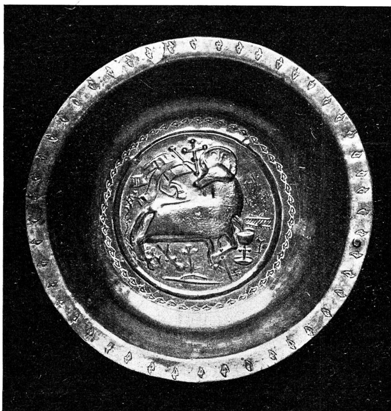
Kupfervergoldete Taufschale von Bennwil aus dem Kloster Schöntal. 13. Jahrhundert. Natürliche Grösse: 7 cm hoch, 27 cm Durchmesser. Aus Geschichte der Landschaft Basel, Bd. I, Abb. 83. S. 188.

wurde. Die Bauernsamen verpflichtete sich, das erforderliche Holz aus dem Blomd, den Grosstannen und Bintzgeron fronweise herbeizuschaffen. Am 9. Juni wurden die Arbeiten vergeben. Da die eine der beiden bisherigen Glocken dem Brande zum Opfer gefallen war, wurde der Zimmermann beauftragt, mit seinem Gesinde das Glöcklein im Schöenthal abzubrechen und in Bennwil wieder anzuschlagen. 24) Es trägt die