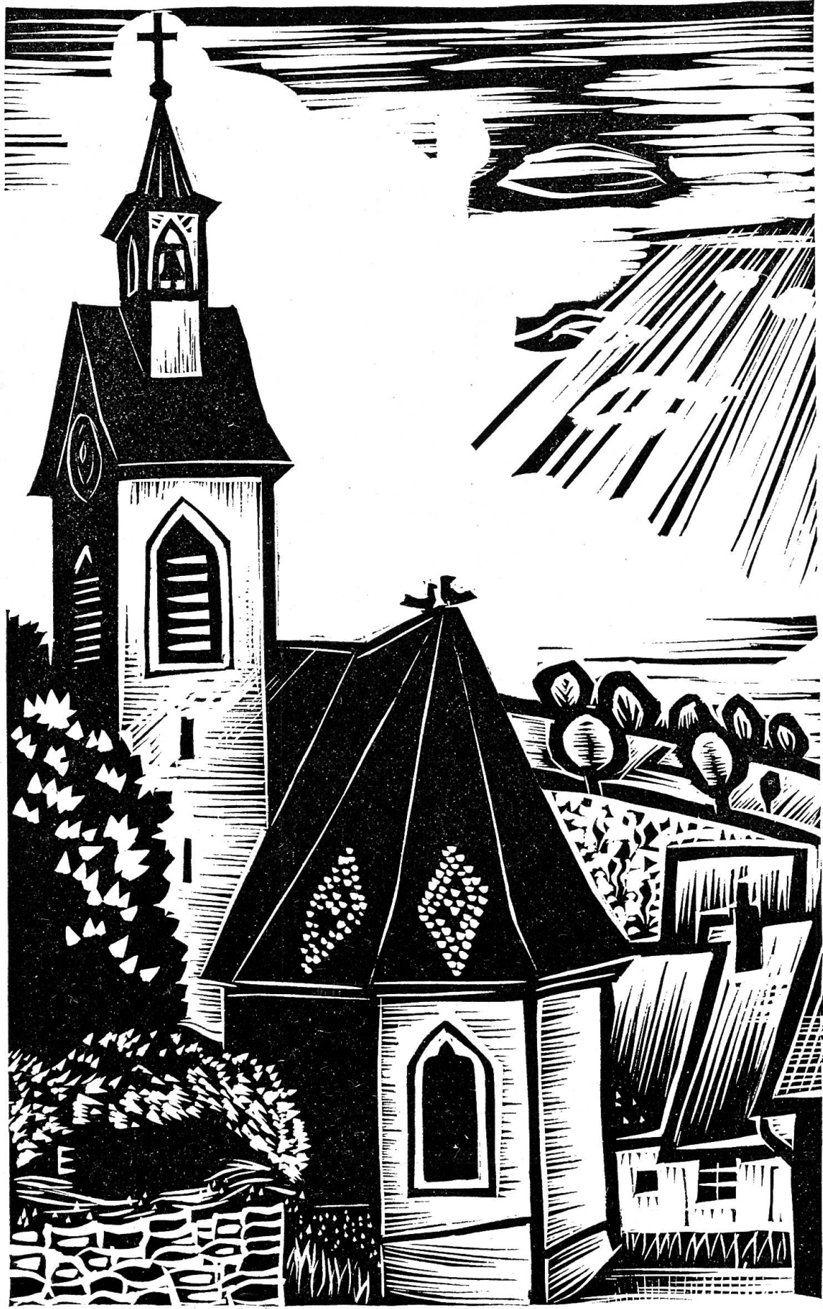
Kirche von Bennwil.