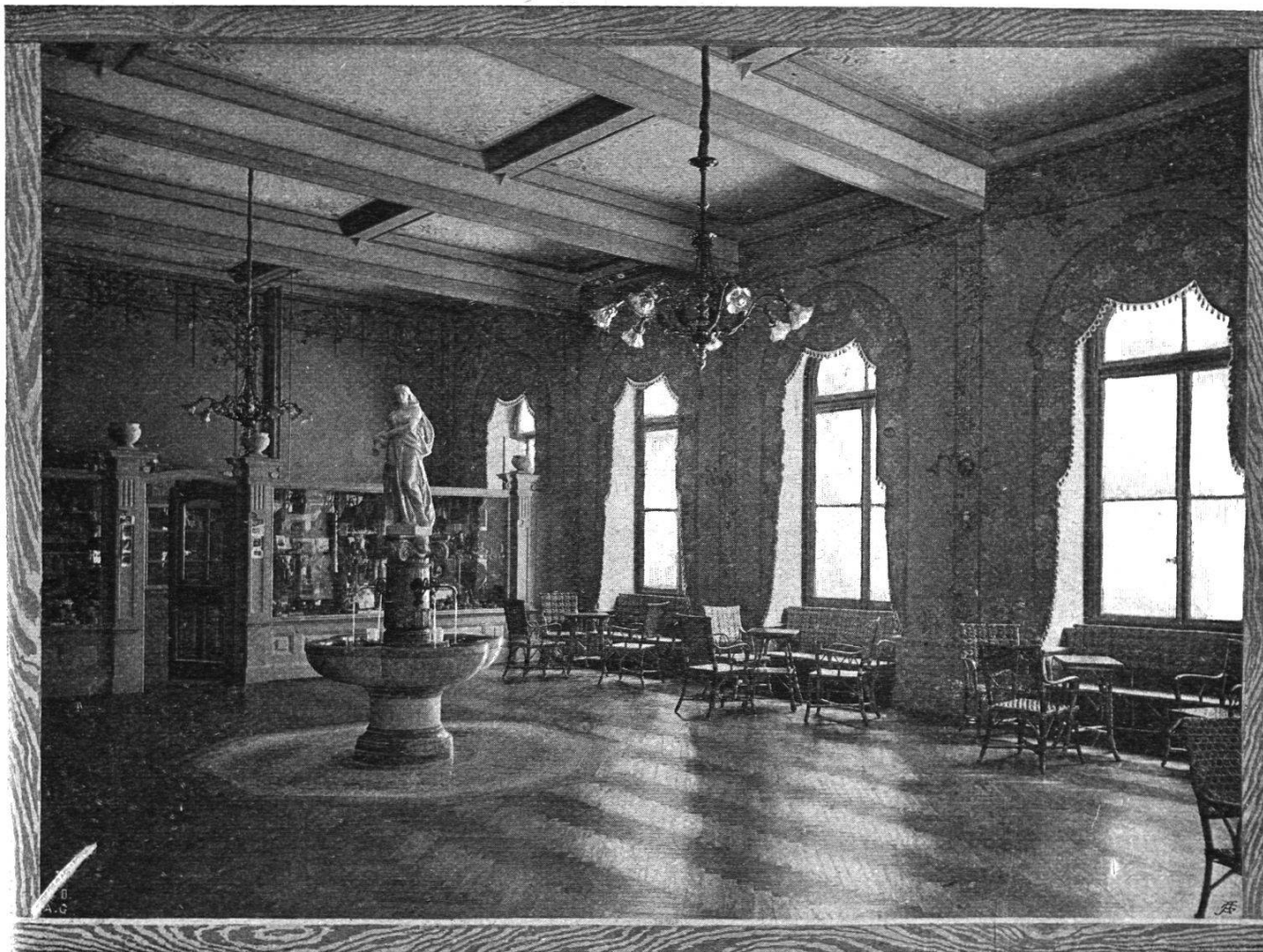
Die neue Trinkhalle mit Bazar.

Die baulichen Verbesserungen lassen sich auf Grund verschiedener Ansichten des 18. Jahrhunderts feststellen. Schon früh muss das Wasser auch verschickt worden sein. Aus einem Gutachten des bernischen