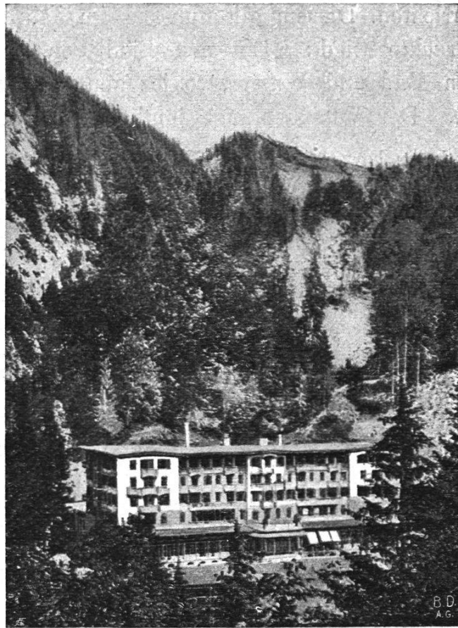
Neues Bad Weissenburg.