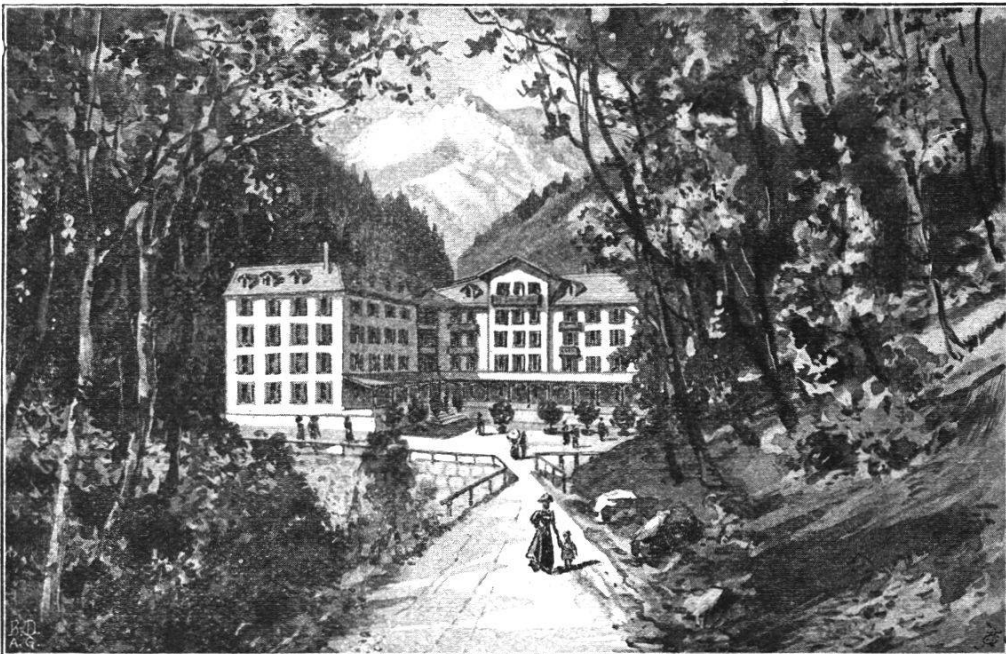
Das alte, hintere Bad Weissenburg.