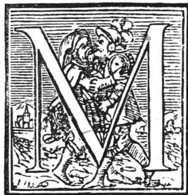
Initialen aus dem „Plutarch“, 1571 von Jean Le Preux gedruckt