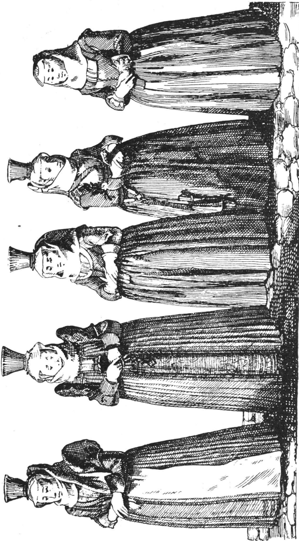
Ein fraux in Kirchen Kleidung So leid treyt.