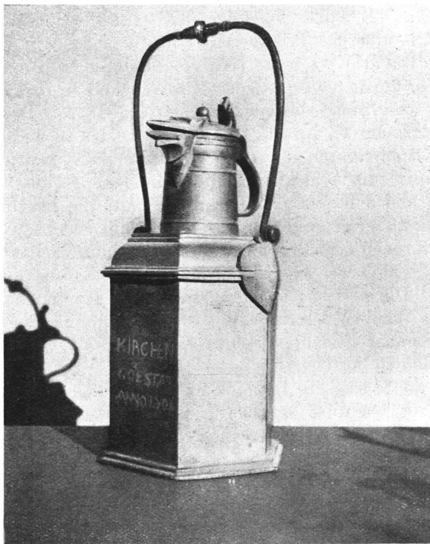
Abendmahlskanne der Kirche Gottstatt. 1706.

schreitenden Eber, auf dem Balken über dem Schild die Initialen H. F. E. Im Inventar der Kirchgemeinde Kappelen befinden sich zwei Abendmahlskannen, die ebenfalls von ihm herkommen. Die Giessermarke ist die gleiche, auch die Ini-