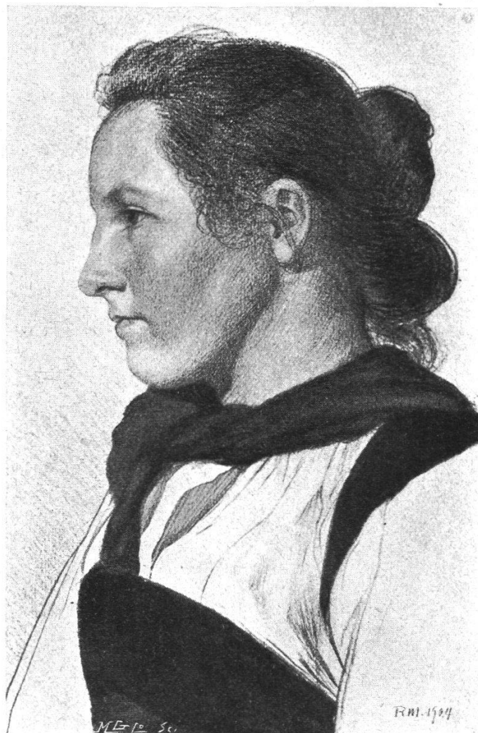
Heutige Emmentaler Tracht. Alltagsgewand mit Halstuch. (Zeichnung von Rudolf Münger.)

wir das städtische „Büürsch“ in Fremdenzentren sowohl wie auf dem flachen Land selber; gute Trachten sind seltener als schöne Mädchen, und sogar die ältere Generation fängt an, sich der alten farbenfrohen Tracht zu schämen.