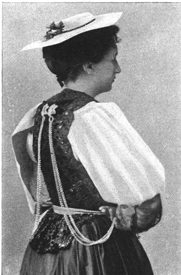
Rückansicht der modernen Bernertracht.

Erst aus dem Jahre 1774 stammt die älteste Abbildung einer eigentlichen Bauerntracht. Es ist ein Stich von Karl von Mechel in Basel und stellt die Frau des Micheli Schüppach, jenes bekannten