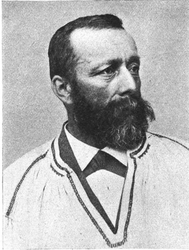
Heutige Emmentaler Tracht. Bauer im Burgunder. (Zeichnung von Rudolf Mürger.)

der im bernischen historischen Museum befindlichen 125 Trachtenbilder des Malers Josef Reinhardt. Dieser besuchte den Kanton Bern in den Jahren 1790 und 1791 und malte in Köniz, Jegistorf, Meiringen, Grindelwald, Hasli im Grund, Guggisberg, Münsingen und im Emmental zwölf Bilder mit je zwei bis drei Figuren, alle im Format