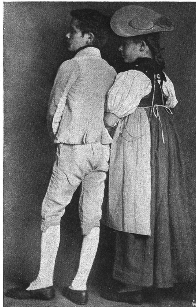
Kindertracht aus dem Emmental und dem Seeland um 1800. Ansicht von hinten. Man beachte die kurze Kittelbrust des Mädchens und den Schnitt der Knabenjacke.