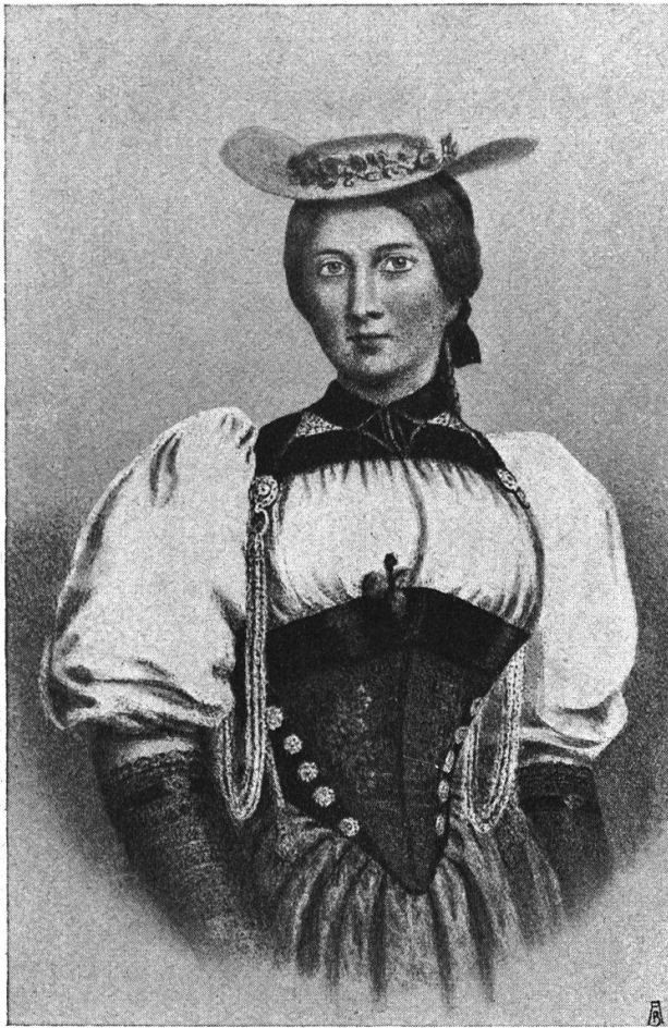
„Städtische“ Bauerntracht von ungefähr 1830. Kittelbrust mit Schneppe, Haften und Ketten, weiches Hemd, Schwefelhütlein, Filethandschuhe. (Nach einer farbigen Lithographie.)