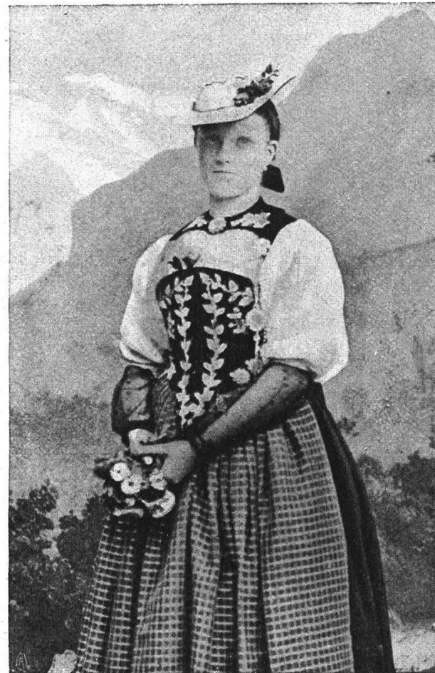
Emmentaler Bauerntracht um 1860. Gestickte Kittelbrust mit Ketten, halbgestärktes Hemd, galan- derierte Schürze, Hütlein, Filethandschuhe.