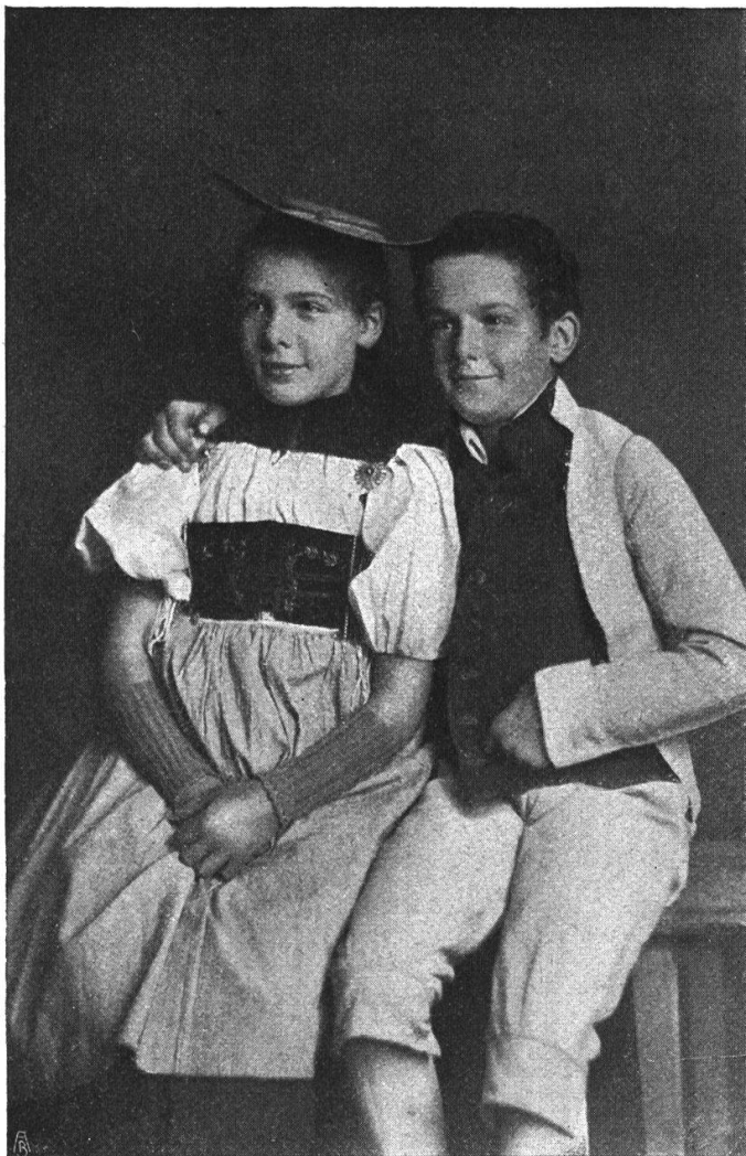
Kindertracht aus dem Emmental und dem Seeland um 1800. Mädchen: Kittelbrust mit Kettlein, Kittel, Schürze, Hütlein. Knabe: Elba Jacke (Chuttli), farbige Weste. (Originaltracht im schweizerischen Landesmuseum in Zürich.)