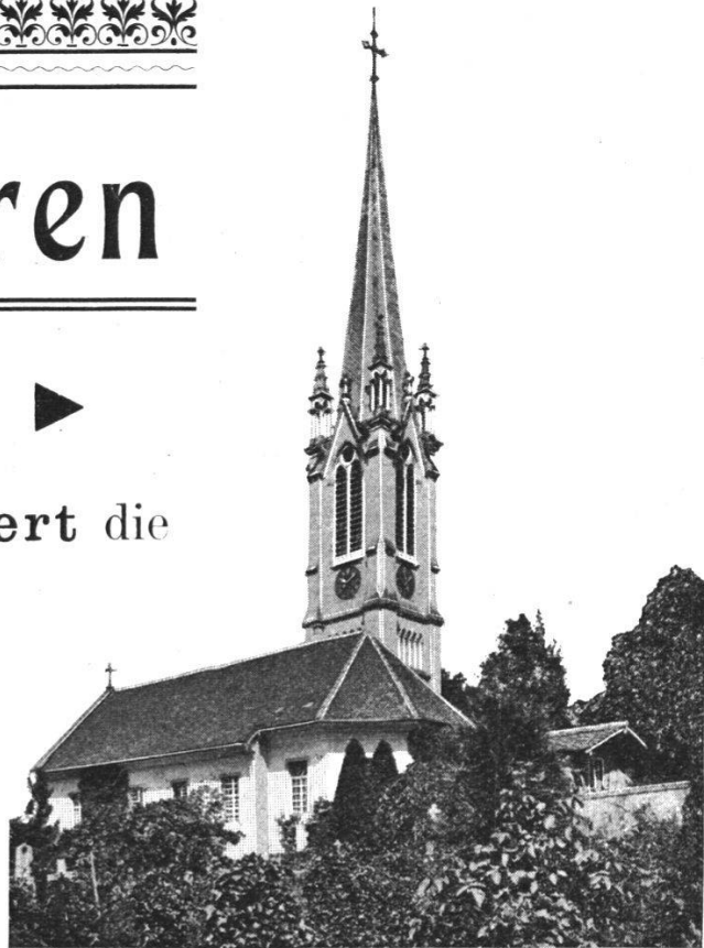
Turmuhr Muri, renoviert 1903.