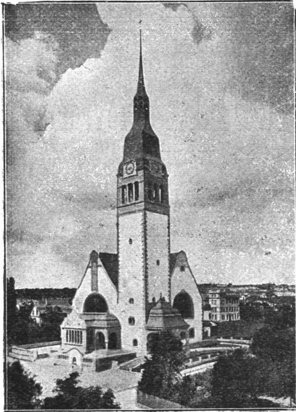
Pauluskirche in Bern.