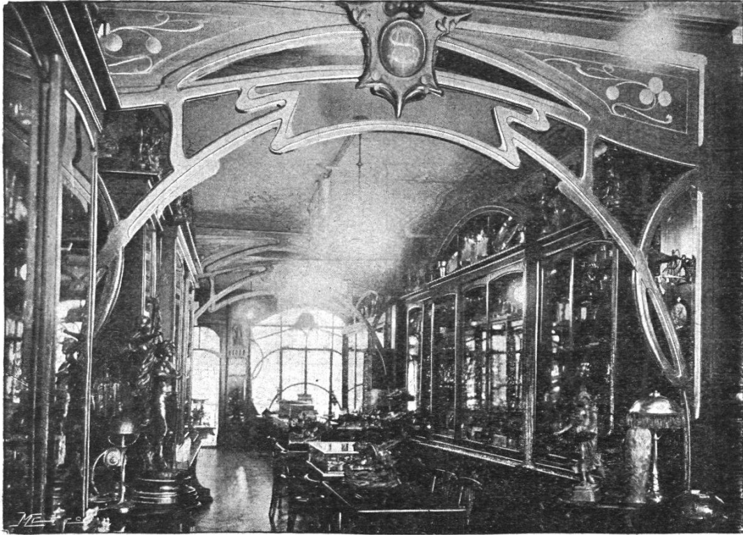
Ansicht des Magazins